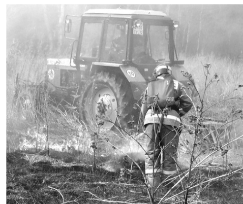
• Лучшее лесного ранцевого огнетушителя в борьбе с пожарами пока ничего не придумали.

Александр ПОНОМАРЁВ Фото из архива редакции