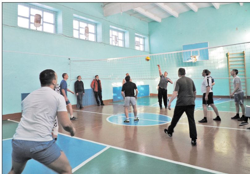
Команды играли чётко и слаженно