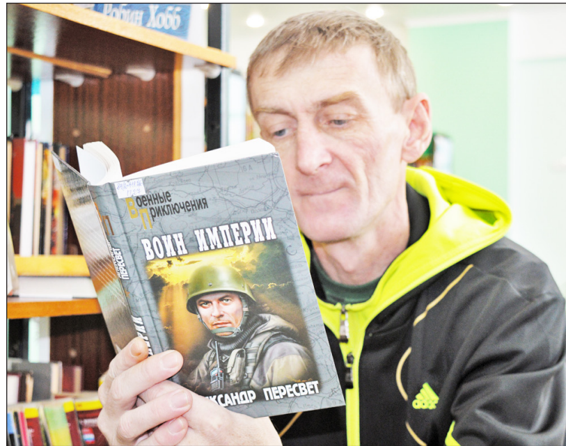
Если книга мужчину заинтересует, он забывает обо всём на свете

праздника – Дня защитника Отечества – Казанская районная библиотека предлагает вам, уважаемые мужчины, подборку книжных новинок современных российских авторов, представленную в разных литературных жанрах.