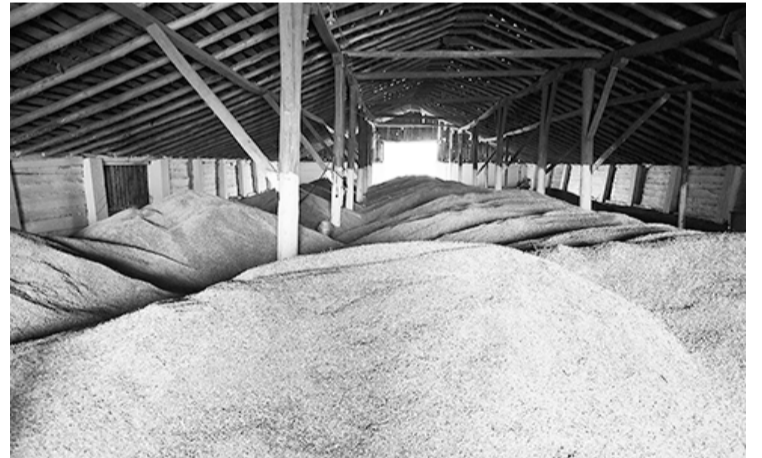
Закрома полны зерна

ращивают КРС мясного направления. Привесы хорошие, реализуют свой живой товар в СЗСПК «Молоко» и, если удаётся, на Север.