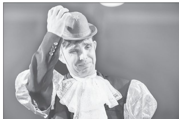
Знакомьтесь, царь! В спектакле это директор крупной фирмы