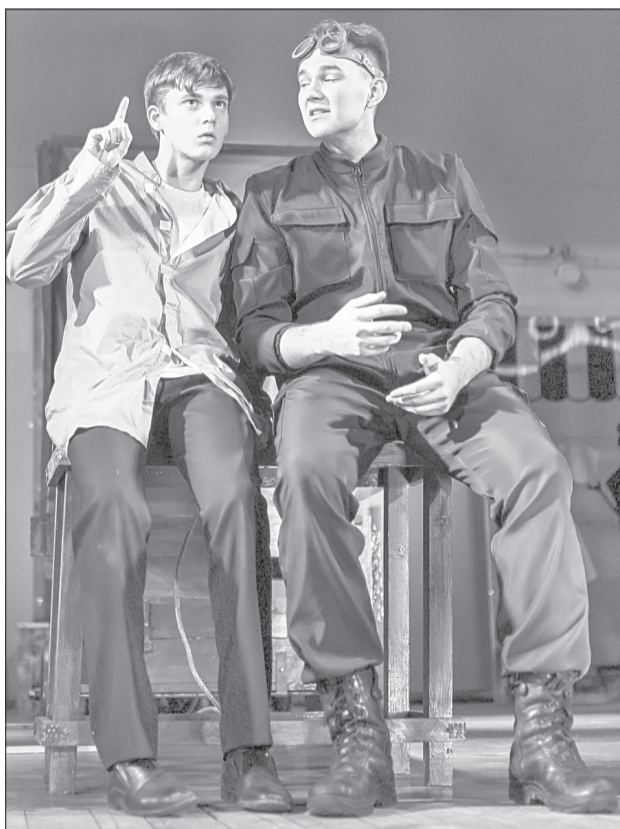
У Ивана (слева) в помощниках был вот такой Конёк-Горбунок - ростом под два метра и в униформе

Смелое прочтение. Начало спектакля не предвещало интриги. Действо, происходящее в городе N, разворачивалось по канонам сказки. Помните? У одного отца (в спектакле - Бати) было три сына, которые по очереди выполняли сложные родительские поручения, чтобы оправдать доверие. На Ивана-дурака никто не возлагал надежд, а он оказался самым умным. Вместе с верным помощником Коньком-Горбунком исполнил не только наказы отца, но и прихоти капризного царя. И что с того, что Конёк предстал перед нами в человеческом облике, ростом не с три вершка, а под два метра и в униформе сотрудника силовых структур? Прямая параллель с нашей жизнью! В одной мизансцене