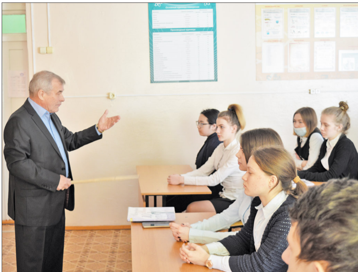
Парламентский урок для одиннадцатиклассников Новоселёзневской школы ведёт депутат областной думы Владимир Ильич Ульянов

13 февраля в Казанский район с рабочим визитом прибыл депутат Тюменской областной думы Владимир Ильич Ульянов. Он побывал в Новоселёзневской школе, где провёл для учащихся 11 класса парламентский урок, посвящённый 25-летию установления современного конституционно-правового статуса Тюменской области.