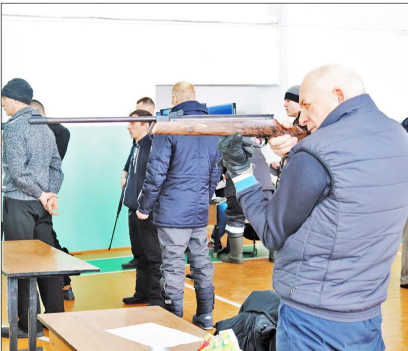
На стрелковом рубеже