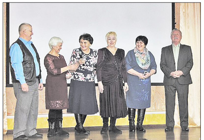
Слова благодарности школе и преподавателям – от выпускников 1969 года

В. ЛУКИНА, учащаяся 11 «б» класса Казанской школы