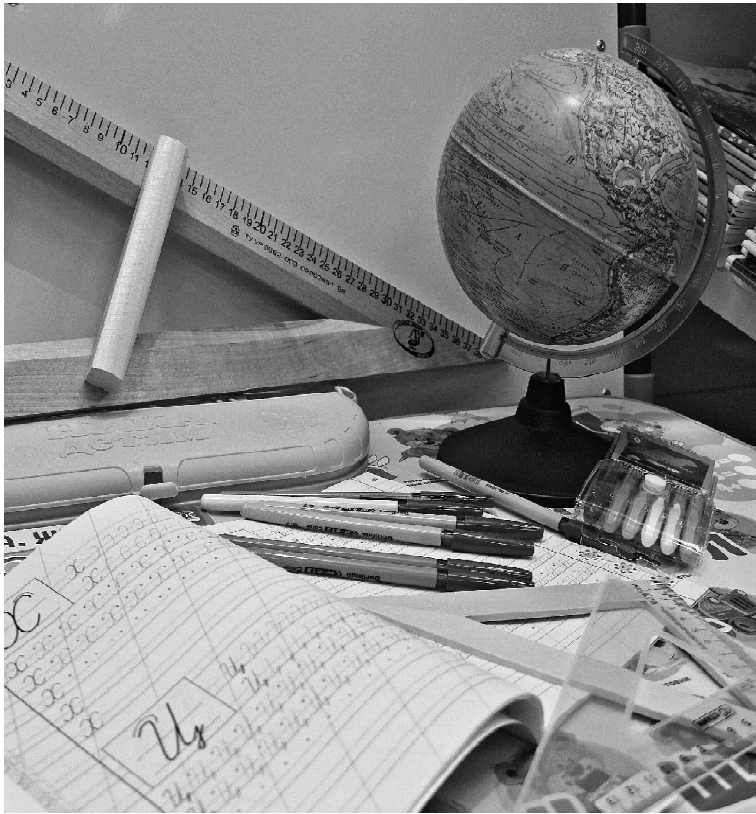
» Фото Татьяны СУХОВОЙ