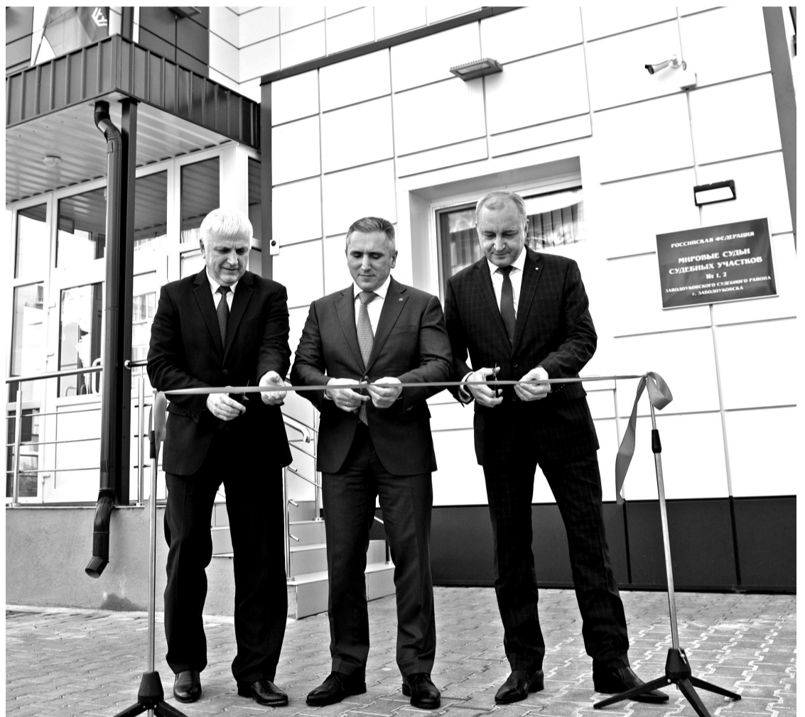
• Глава округа Александр Анохин, губернатор области Александр Моор и председатель Тюменского областного суда Вячеслав Антропов (слева направо) торжественно открывают реконструированное здание мирового суда на улице Васильковой в Заводоуковске.

«Внедрять новые инвестпроекты, реализовывать уже существующие и получать от них отдачу – основная задача областной и муниципальной власти», – сказал губернатор области Александр Моор во время деловой поездки в Заводоуковск 13 сентября.