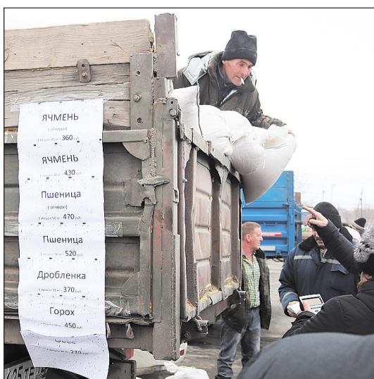
Хорошим спросом пользовалось зерно