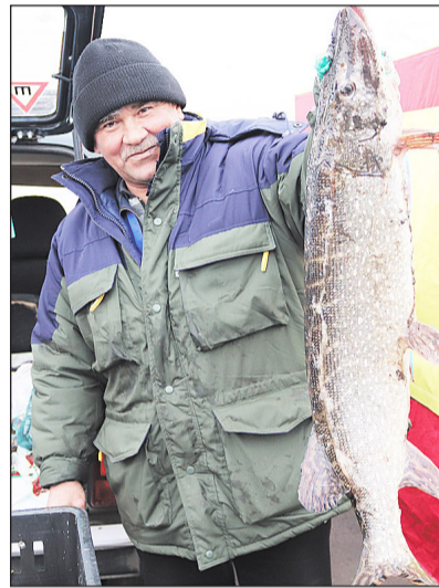
Такую щуку можно было приобрести на ярмарке

Также на ярмарке было множество прилавков с выпечкой, кондитерскими изделиями, овощами и фруктами. По традиции приняли в ней активное участие предприятия общественного питания. Можно было согреться кружечкой ароматного чая или кофе со свежей сдобой, а мясоедам – отведать порцию шашлыка.