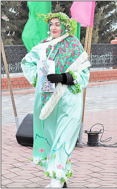
Без работников культуры праздник был бы не столь красочным

Ярмарочный ритейл создаёт комфортные условия для реализа-