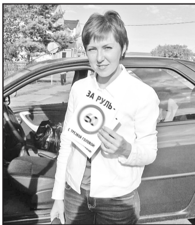
Спиртное и автомобиль – понятия несовместимые

В рамках профилактического мероприятия «Внимание – дети!», проводимого на территории Тюменской области с 22 августа по 18 сентября 2016 года, волонтеры Казанского центра развития детей совместно с сотрудниками ГИБДД на улицах села Казанского провели акцию «Трезвые рулят!». Мероприятие проводилось с целью популяризации трезвого образа жизни среди населения и недопущения дорожно-транспортных происшествий. Волонтеры призывали водителей не садиться за руль в состоянии опьянения, перевозить детей в салоне автомобиля с помощью детских удерживающих устройств, быть законопослушными и вежливыми на дорогах, вручали им листовки «За руль – с трезвой головой!», «Скорость – убийца», «Уважаешь себя – уважай других!». Водители, улыбаясь, слушали и благодарили волонтеров за разъяснительную работу.