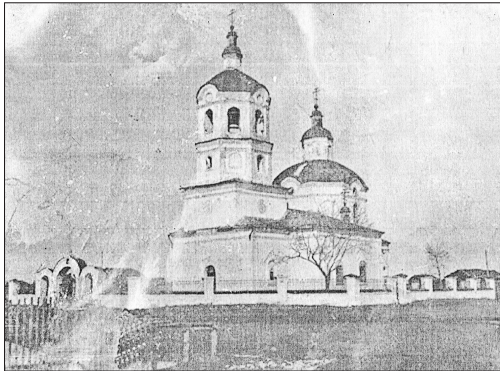
Ильинская церковь. Фото 50-х годов XX века

На церкви велись наружные работы. Яркой белизной сквозь леса просвечивались оштукатуренные и побеленные стены, зазеленела покрашенная свежей краской новая жестяная крыша. Вот и на колокольной маковке Жора готовится установить первый крест, покрашенный яркой жёлтой краской. Возле церкви собралось много народу. Все с замиранием сердца смотрят, как на высоте 27 метров Жора без какой-либо страховки на открытой площадке возится с крестом.