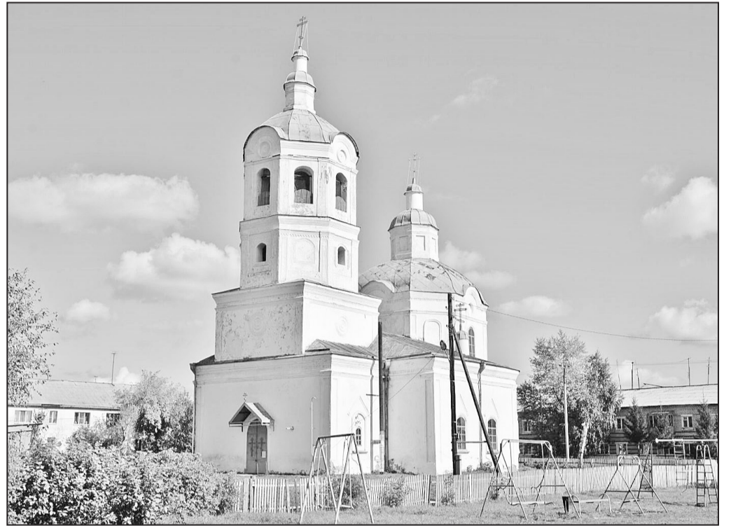
Ильинский храм в наши дни