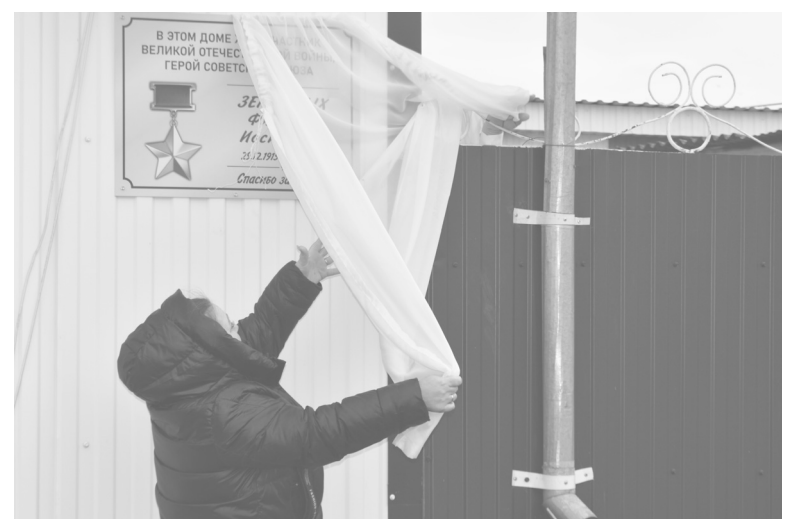
Теперь на доме, где жил Филимон Земляных, размещена памятная табличка