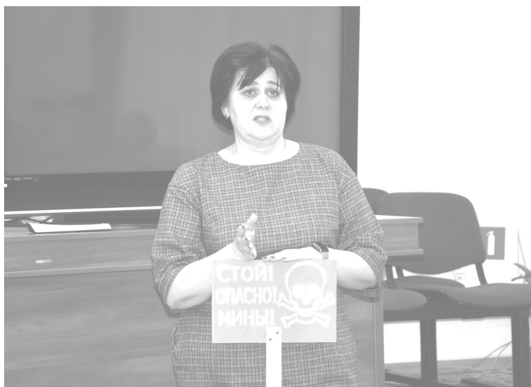
Более 200 таких табличек отправили нашим бойцам