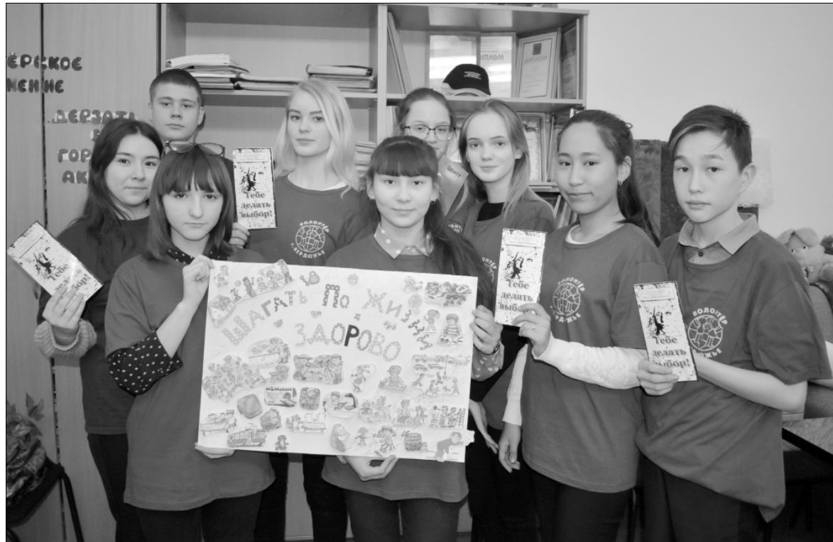
К каждому мероприятию ребята рисуют плакаты и раздают листовки