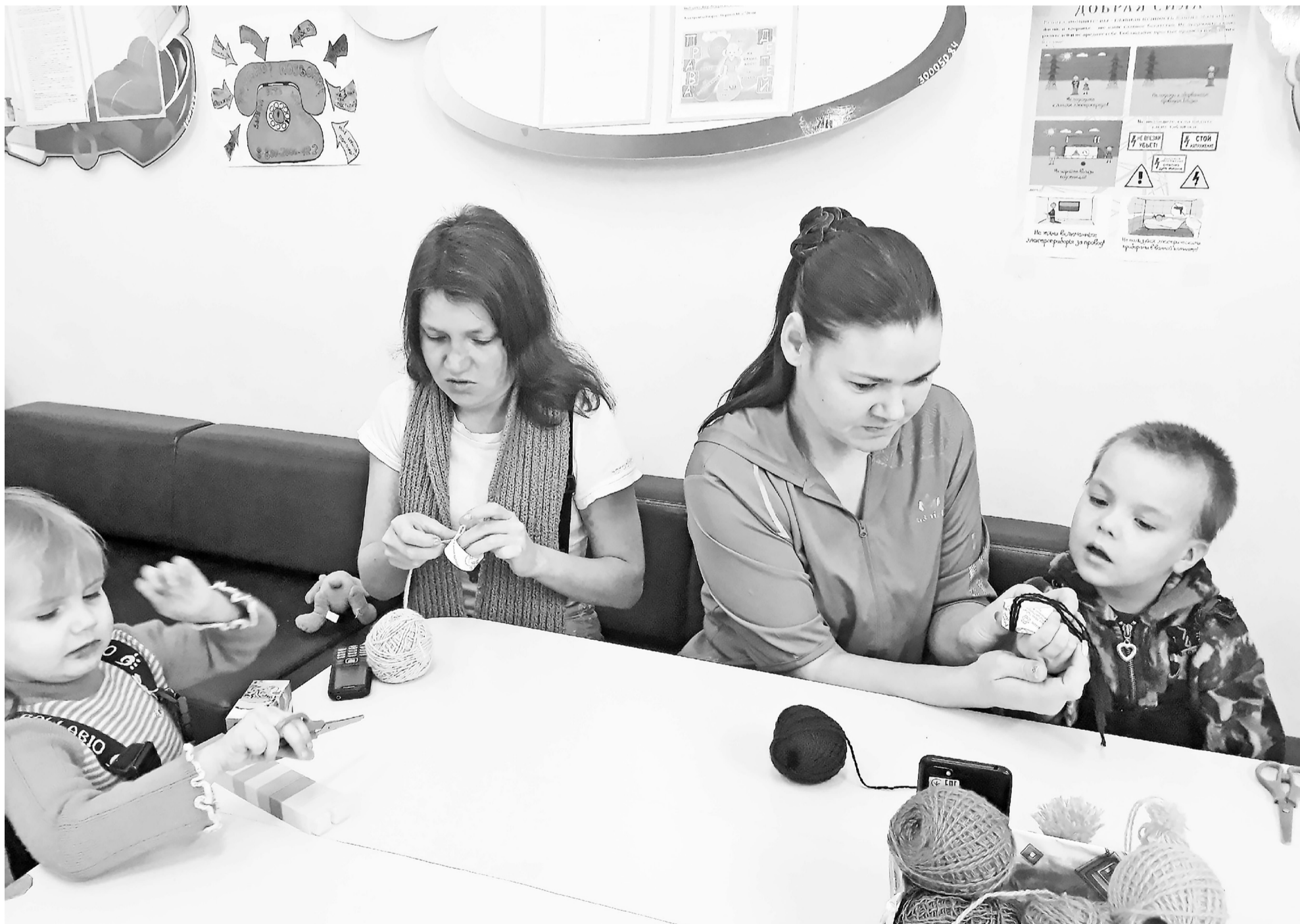
Инициативы Президента помогут семьям с детьми улучшить жизнь и будут стимулировать рождаемость.

Информирование людей, разъяснение алгоритмов действия – главная на сегодняшний день задача