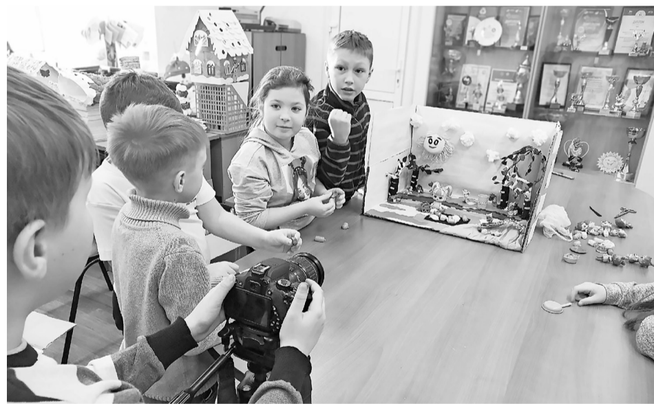
Занятие в творческой студии «ЛИС» – создание нового мультфильма.

Большую работу проводим с участниками Российского движения школьни-