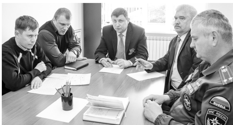
Итоги круглосуточного мониторинга пожарной обстановки в ишимских лесах, сельских поселениях ежедневно обсуждаются на заседаниях оперативного штаба.

– Начиная с апреля на нашей территории произошло пять пожаров. К сожалению, зачастую причина случившегося – поджог. Одного поджигателя удалось задержать в