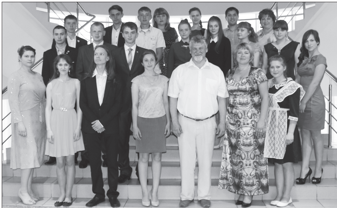
Общее фото на память.

Затем официальная часть плавно перешла в неформальное общение, разговор состоялся непринужденный, доброжелатель-