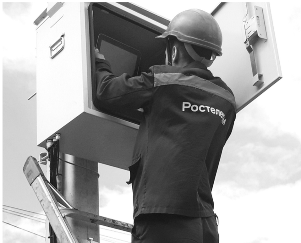
У сорокинцев появилась возможность подключиться к интернету