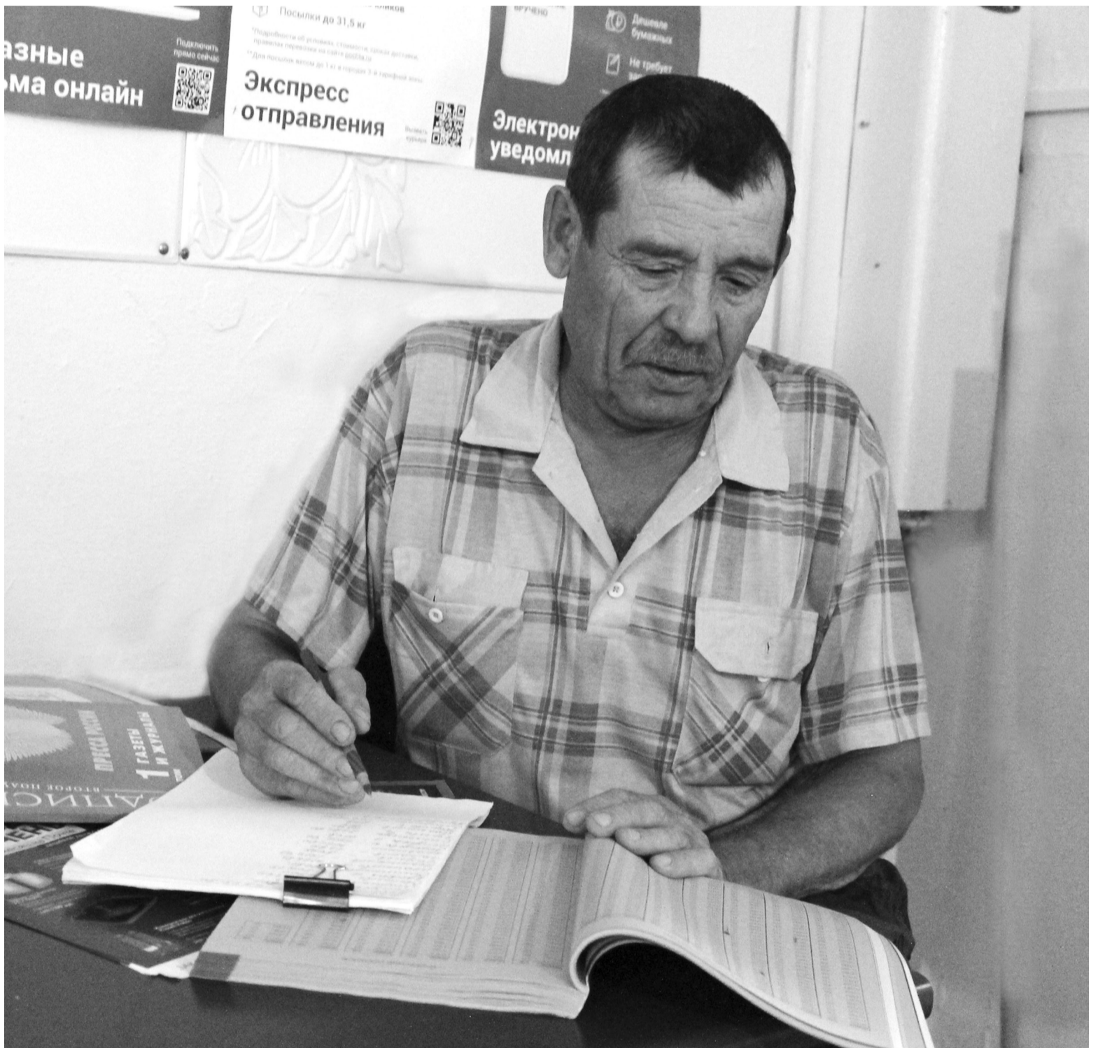
Деревенский почтальон готовится к очередному рабочему дню

дого выслушать, поговорить, где-то даже подбодрить, успокоить, а не просто безразлично опустить письмо в ящик и уехать. Иначе нельзя, почтальон в деревне всегда был своим человеком. Попутно привожу населению почтовые товары, ведь сейчас почта напоминает маленький магазин, где можно купить предметы первой необходимости. Мне заказывают, и я никогда не отказываю. Иногда трудно приходится. Особенно зимой или осенью, когда дороги становятся труднопроходимыми. Что делать, мы же как спасатели – в любую погоду! У