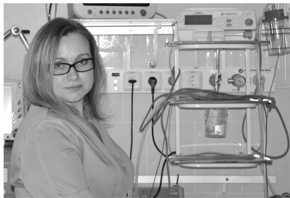
Врач советует сделать прививку

Инсульт – само по себе грозное заболевание, а если оно протекает параллельно с новой коронавирусной инфекцией, то такие пациенты