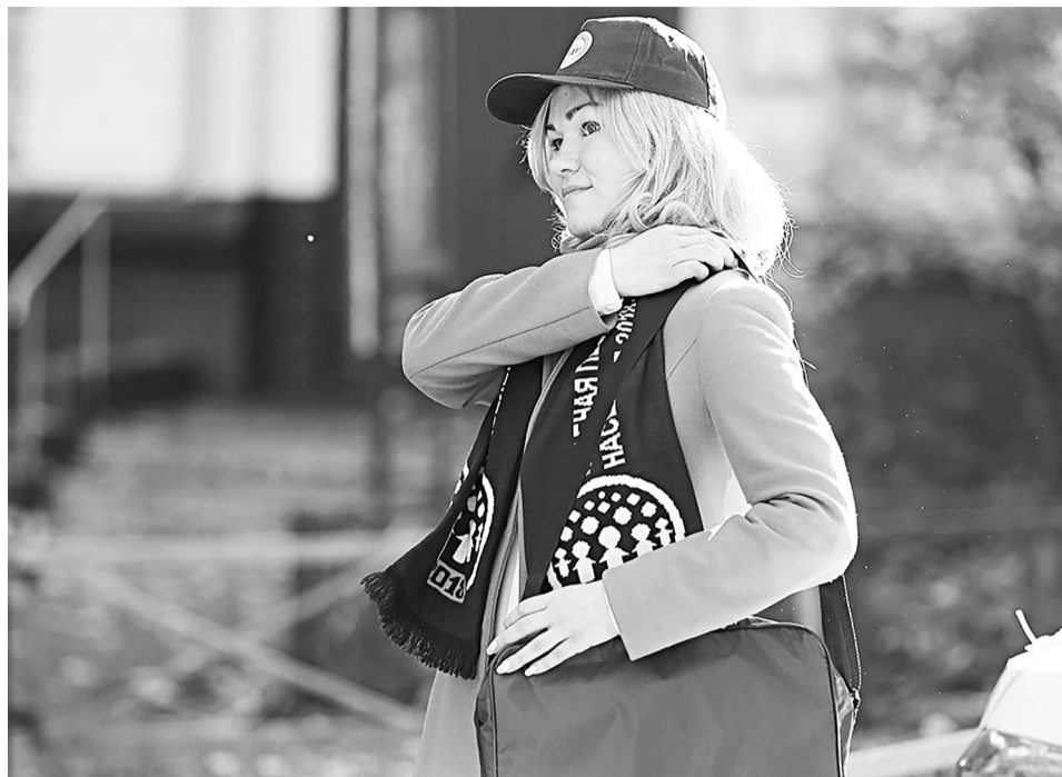
Переписчики будут снабжены современными планшетами с установленной отечественной операционной системой.

Есть электронный переписной лист для внесения данных. Обеспечена автоматизация ряда функций по сбору информации, что значительно сократит время обработки данных. Встроенные