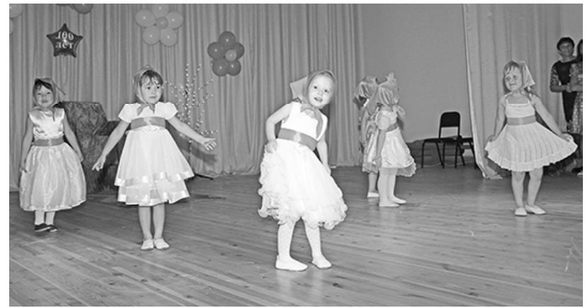
* Танец «Неваляшки»