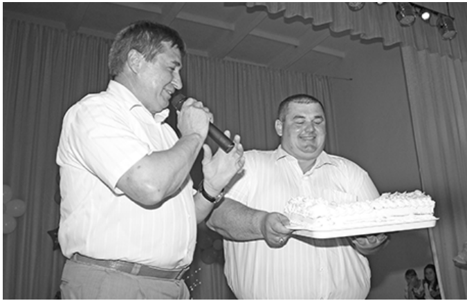
* В подарок – новоандреевский торт