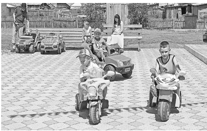
* На электромобилях