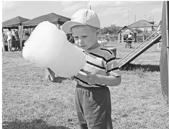
* «Ах, как вкусно!»