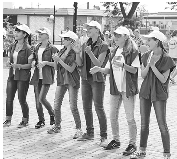
* «Поддерживаем своих!»