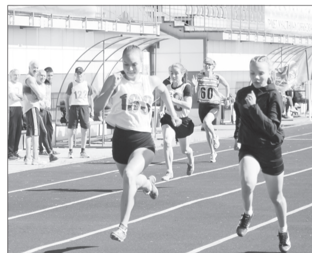
Состязания открыли легкоатлетическими забегами и эстафетами на дистанциях 4x100, 1000 и 2000 метров