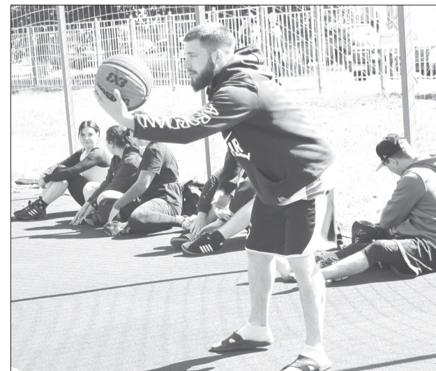
Уличный баскетбол по формуле 3x3 в одну корзину уже стал частью молодёжной культуры