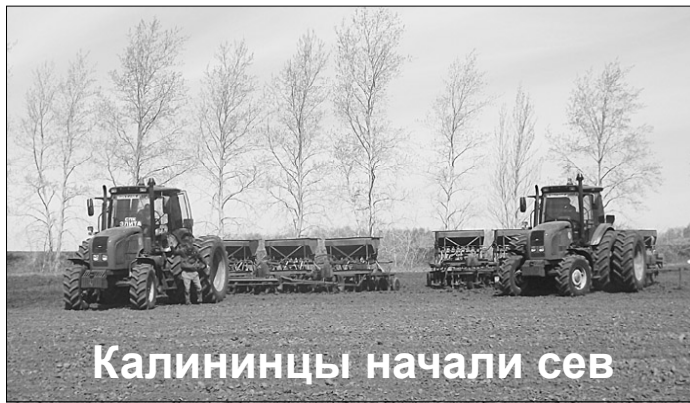
Калининцы начали сев