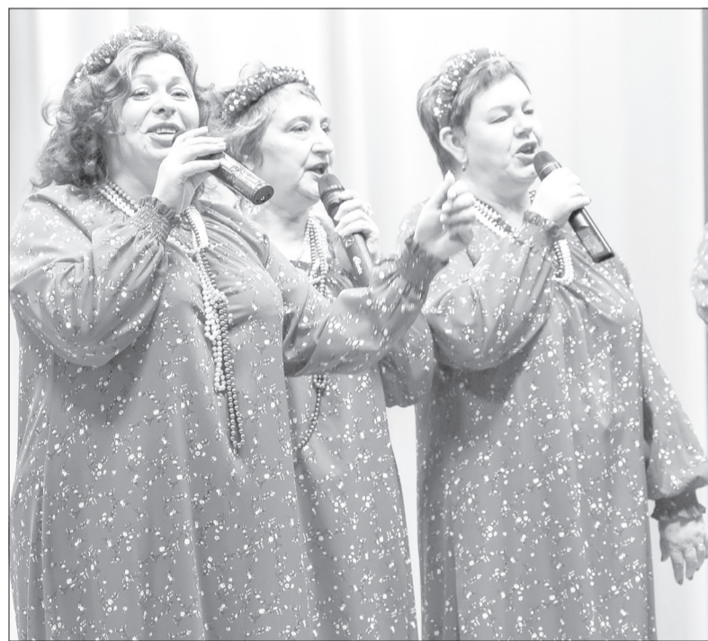
Вокальная группа «Россияночка» из Старого Кавдыка исполняла любимые селянами композиции