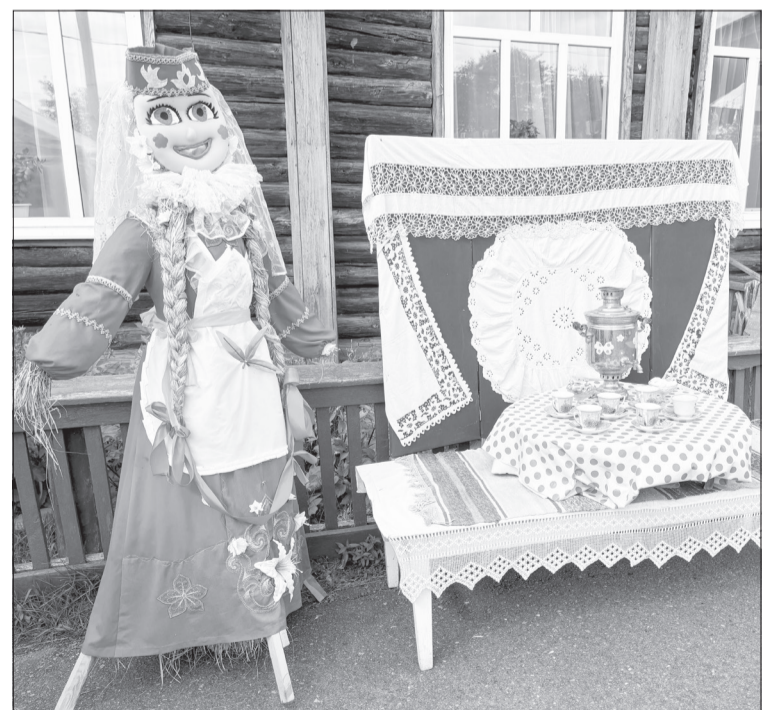
Ревдинцы на своей площадке организовали фотозону с национальным колоритом

■ Праздничные концерты прошли во всех пятнадцати сельских поселениях, а участниками мероприятий стали более двух тысяч человек