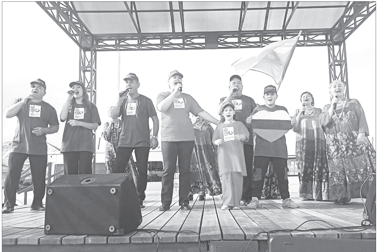
В заключительном концерте автопробега участвовали творческие коллективы со всего Ялutorовского района