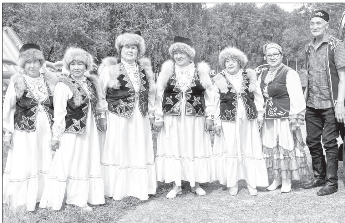
Артисты из асланинского Центра татарской культуры завершили финальный концерт песней о любви к родному краю