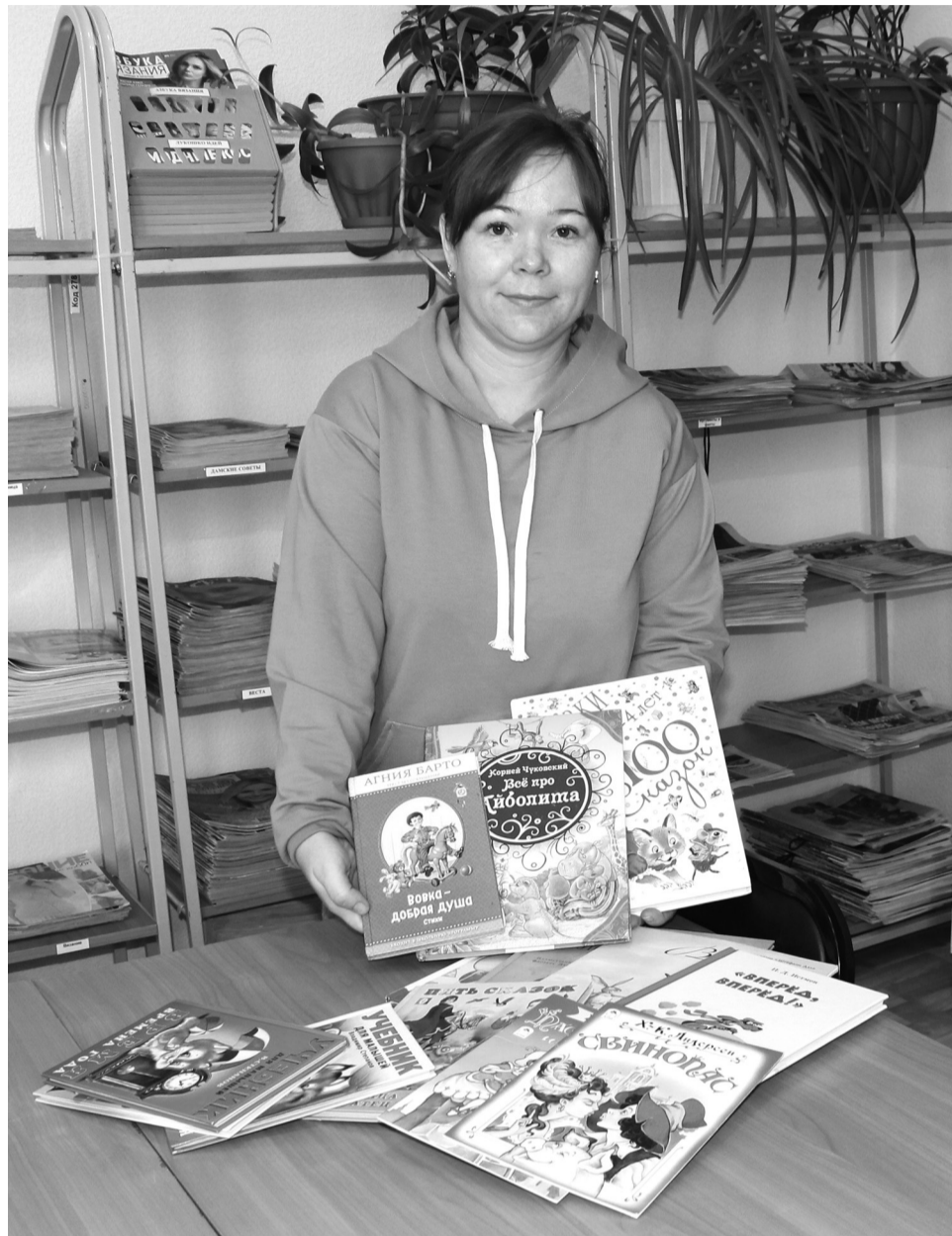
Среди первых книжек, принесённых в рамках акции, – детская литература

Если вы неравнодушные граждане, коллективы, учреждения, некоммерческие организации, желающие подарить книги, то вы можете обратиться в места для сбора книг: с. Большое Сорокино, ул. 40 лет Октября, д. 1 (районная библиотека); с. Осинька, ул. Советская, д.35 (Осиновская сельская библиотека); с. Готопутово, ул. Центральная, д. 40; с. Ворсиха, ул. Новая, д.21 (Ворсихинская сельская библиотека); с. Покровка, ул. Центральная, д. 16 (Покровская сельская библиотека); с. Калиновка, ул. Зелёная, д.10 (Калиновская сельская библиотека); с. Нижнепанигино, ул. Центральная, д.54 (Панигинская сельская библи-