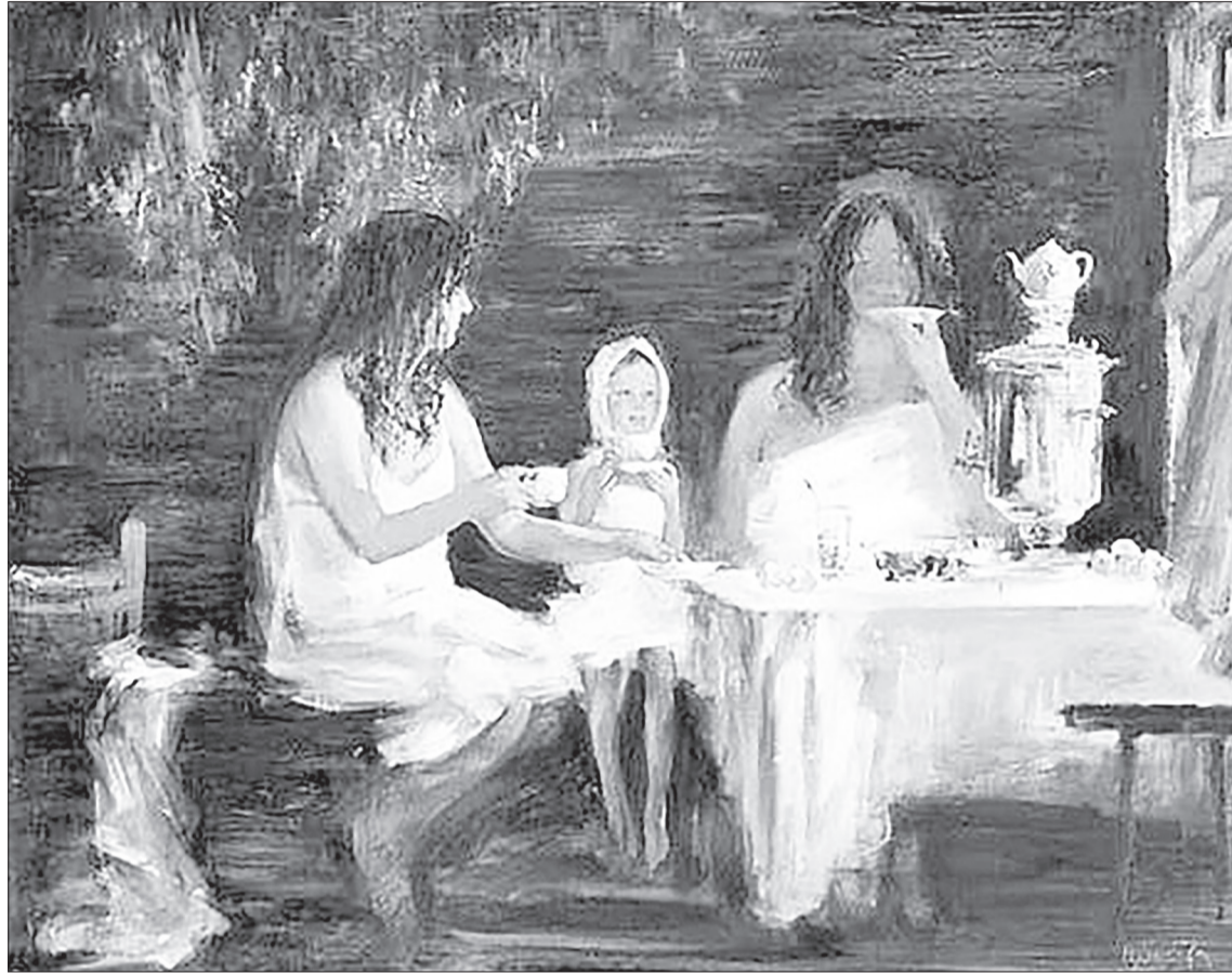
И хотя у многих есть частные бани, общественная баня могла бы стать местом культурного досуга. / РИСУНОК ИРИНЫ РЫБАКОВОЙ.

– У нас в районе есть ещё три бани на базе автокемпин-