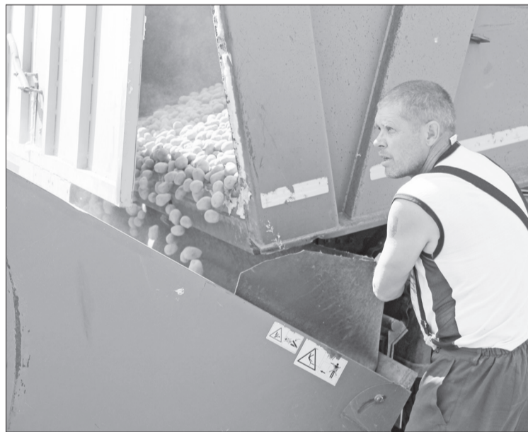
Пока тракторист рулит, его помощник следит за работой агрегата.