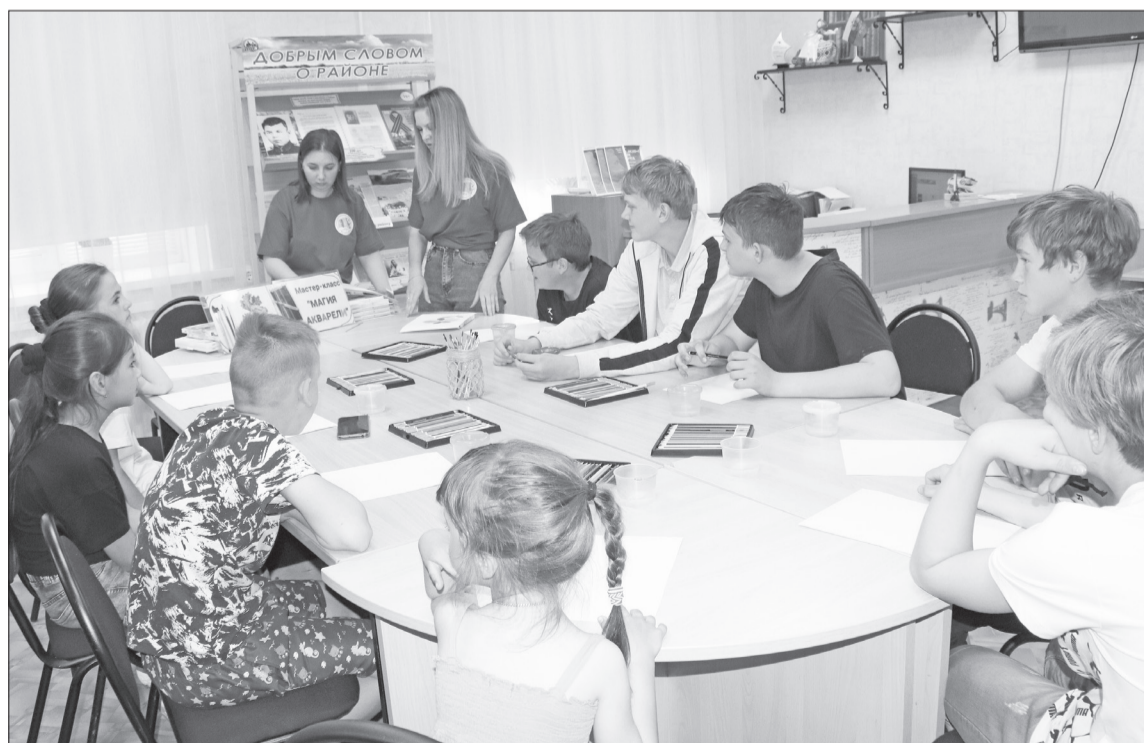
Один из этапов библионочи – станция «Магия акварели». / ФОТО АВТОРА.

ствия участники мероприятия уютно расположились на мягких диванах и с удовольствием посмотрели российский комедийный фильм «Артек. Большое путешествие».