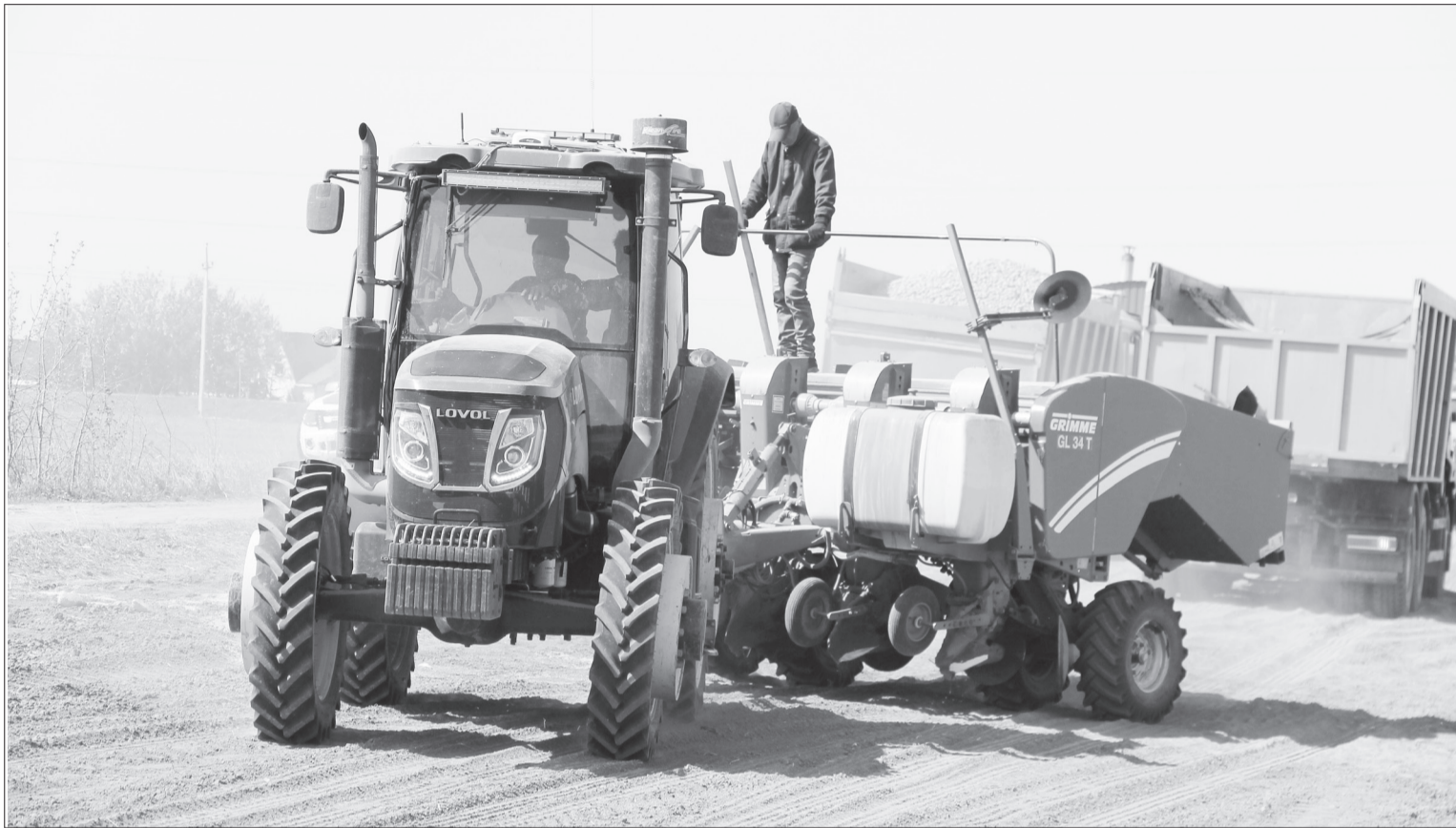
На полях «АП «Продукт» идёт процесс погрузки картофеля в картофелесажалку.

О трудовых и героических буднях полеводцов