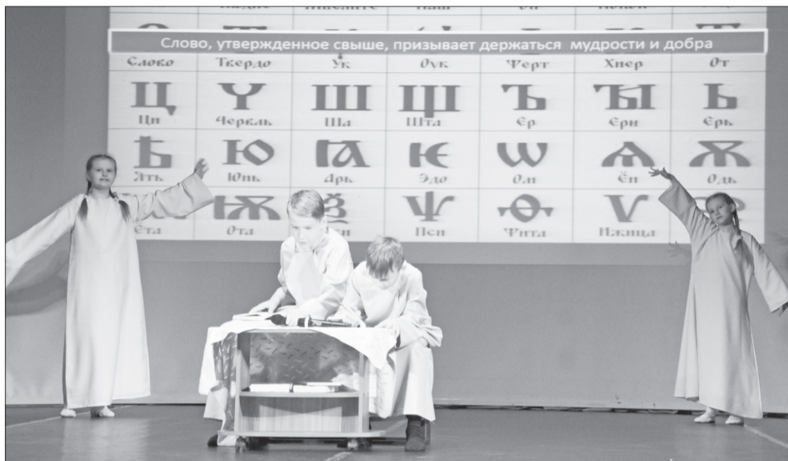
Кадр из постановки. Ангелы благоволят Кириллу и Мефодию в создании славянской азбуки.

Эти светлые и талантливые дети под чутким руководством прекрасных педагогов не устают нас просвещать и образовывать. Вот и 24 мая немногочисленные зрители, собравшиеся в Центре культуры и досуга «Сибирь», погрузились в эпоху IX века. Их познакомили со святыми равноапостольными братьями Кириллом и Мефодием, с историей создания славянской азбуки, с личностями немецких епископов, которые старались помешать утверждению этой азбуки на славянских землях Великой Моравии. Тогда папа римский Иоанн VIII поддержал