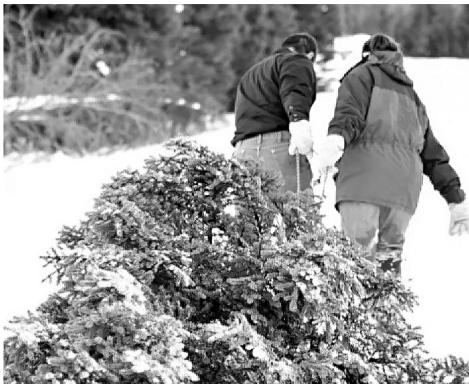
За незаконную рубку хвойного молодняка грозит наказание вплоть до лишения свободы.

Традиционно в декабре лесная охрана совместно с автоинспекцией и полицией