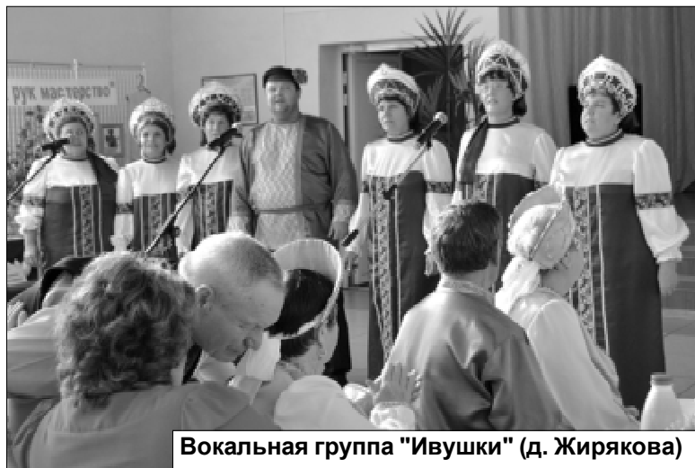
Вокальная группа "Ивушки" (д. Жирякова)

клубу «Ветеран» (РДК) исполнилось 30 лет, а вокальной группе «Ивушки» (Жиряковский СДК) – два десятка... Оба коллектива прошли долгий творческий путь. Сколько событий вместили эти годы, сколько песен спето, сколько наград в копилке достижений!