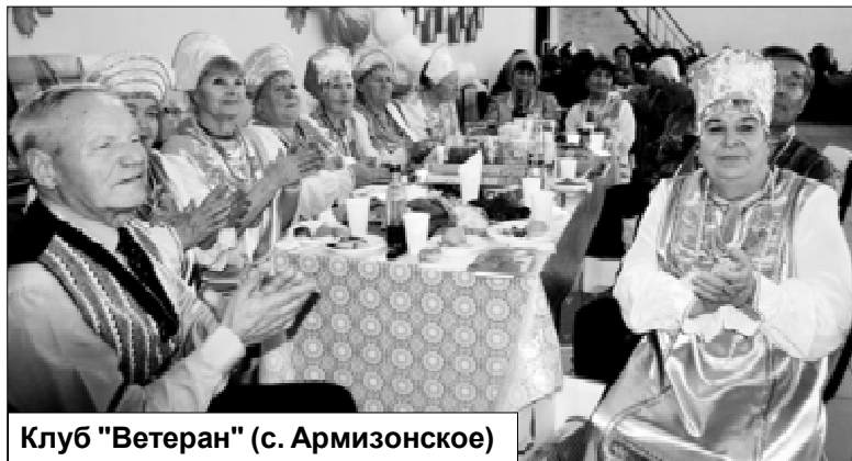
Клуб "Ветеран" (с. Армизонское)

Организатором мероприятия выступил Центр культуры Армизонского района (ЦКАР).