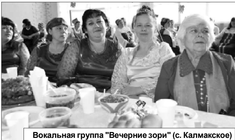
Вокальная группа "Вечерние зори" (с. Калмакское)

Няша* — дно озера, заполненное тиной и грязью Гипотермия** – падение температуры тела ниже 35 °С. и более. Может привести к коме и смерти. Вода забирает тепло у тела приблизительно в 25 раз быстрее, чем воздух.