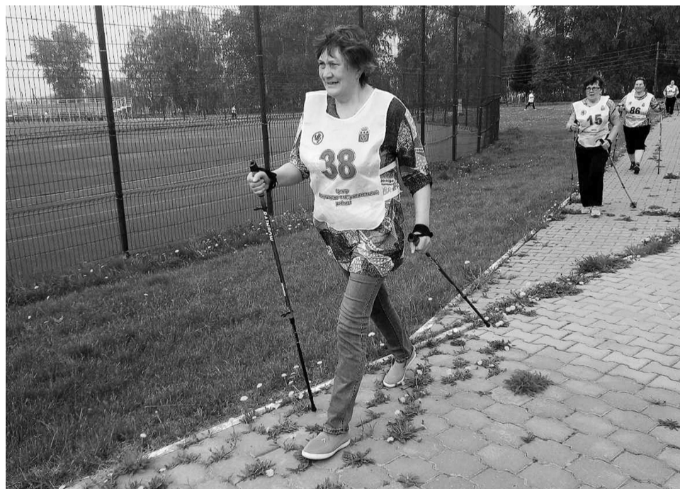
На снимке: участницы спартакиады «Третий возраст»

– Сегодня собрались самые спортивные и позитивные, на которых равняются остальные. Проведение традиционных, ежегодных спартакиад для граждан старшего возраста способствует тому, что в течение года на территориях сельских поселений работают группы здоровья.