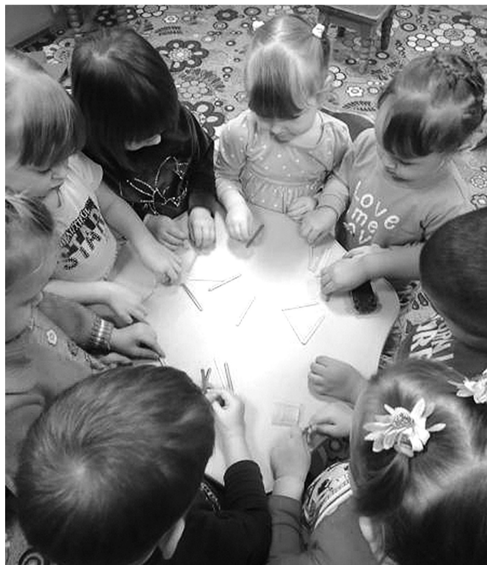
Малыши на логопедическом занятии: игра со счётными палочками

Многие родители не понимают важности поправки малыша в правильности речи. К примеру, мы с ребёнком отработали звук [Ш], и теперь в словах