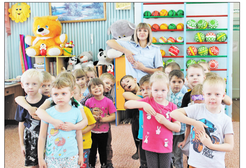
Играя, дети учились правильно пристёгиваться ремнями безопасности

Автоинспекторы района побывали в гостях у воспитанников старшей группы казанского детского сада «Ёлочка». В игровой форме полицейские объяснили детям правила безопасного поведения на дороге. На мероприятии ребята вспомнили правила перехода через проезжую часть и, разделившись на две команды, изготовили пешеходный переход. В ходе встречи сотрудники ГИБДД объяснили дошколятам, для чего нужны ремни безопасности и детские удерживающие устройства, а затем раздали памятки «Внимание: дети». Для закрепления полученных знаний собравшимся было предложено сыграть в игру «Пристегни меня».