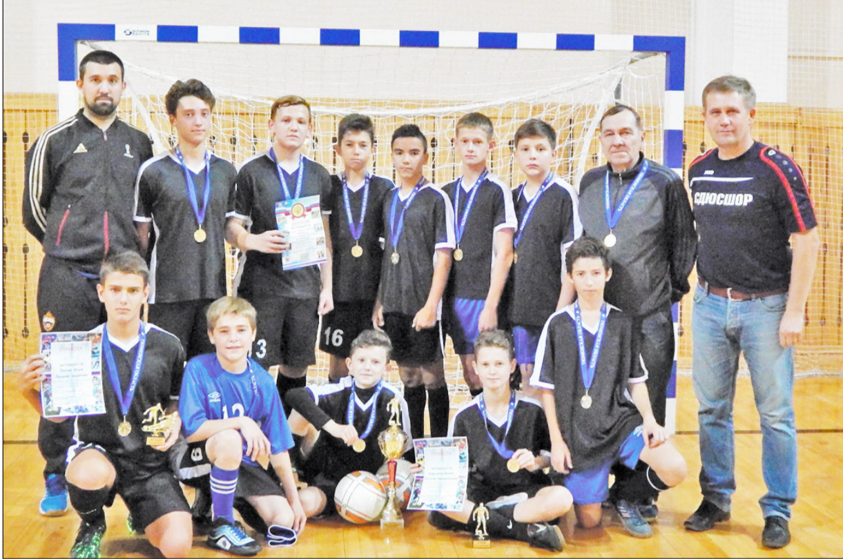
В очередной раз команда «Маяк» стала победителем престижного турнира по мини-футболу

По окончании успешного летнего спортивного сезона, который провела футбольная команда «Маяк», ребята практически сразу начали готовиться к будущим баталиям. Недавно команда приняла активное участие в открытом турнире по мини-футболу среди юношеских команд 2006 – 2007 годов рождения, который состоялся 29 – 30 октября в Ишиме, на спортивной базе спортивно-оздоровительного комплекса «Локомотив».