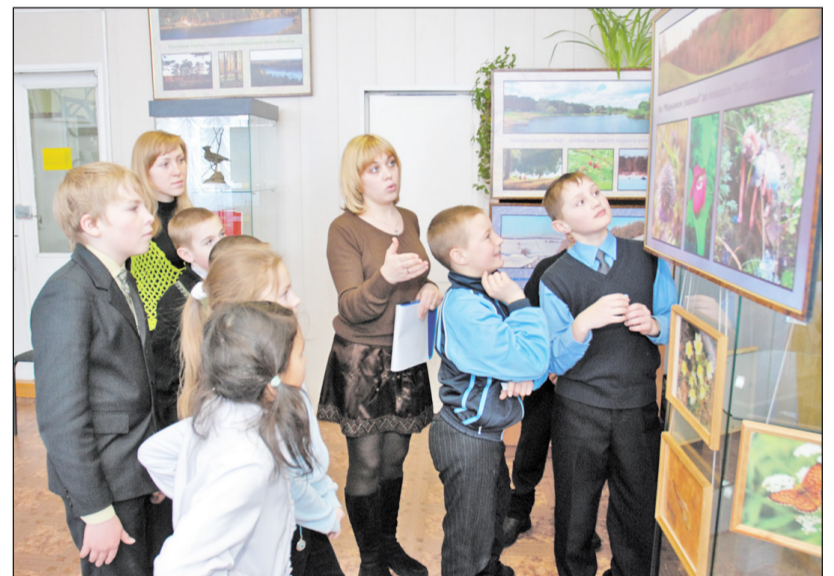
Особенно интересно в музее детям. Здесь можно увидеть много любопытных вещей, с помощью экскурсовода познакомиться с творением рук человека