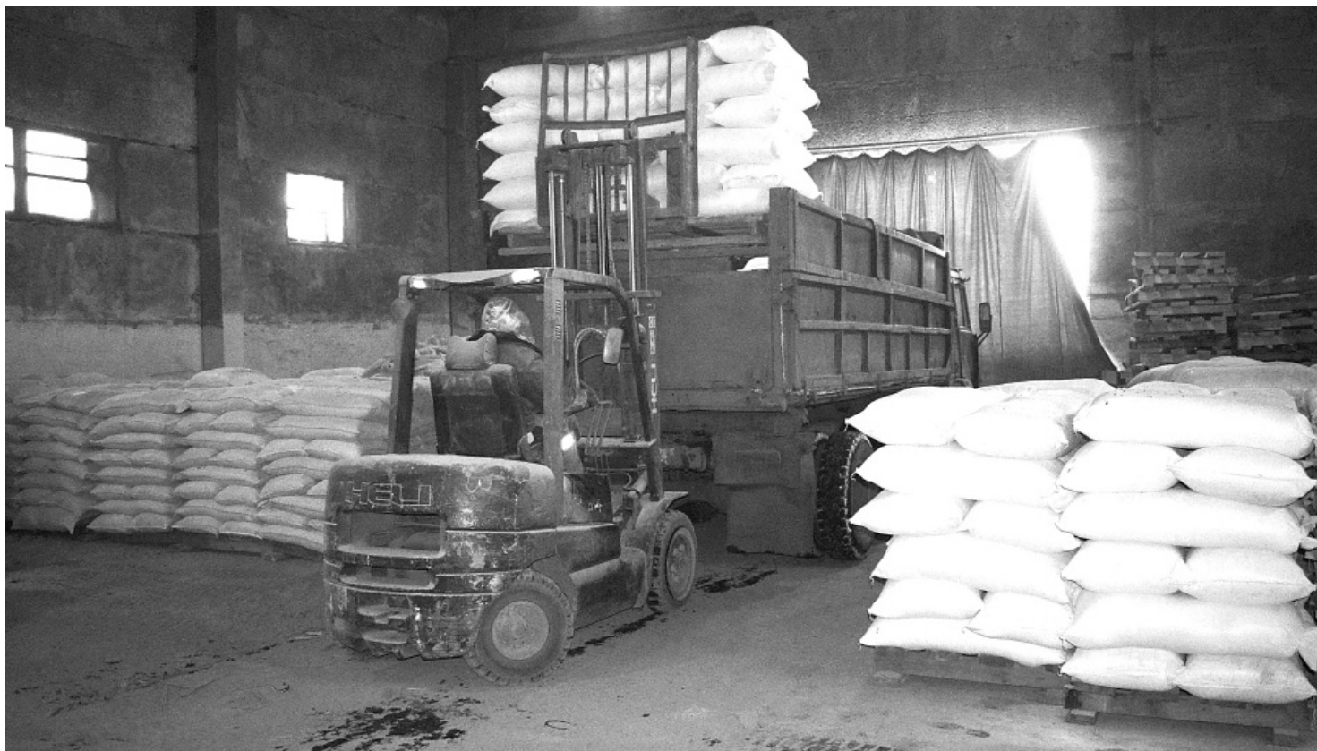
Двадцать тонн муки отправляются в пекарню Голышмановского района