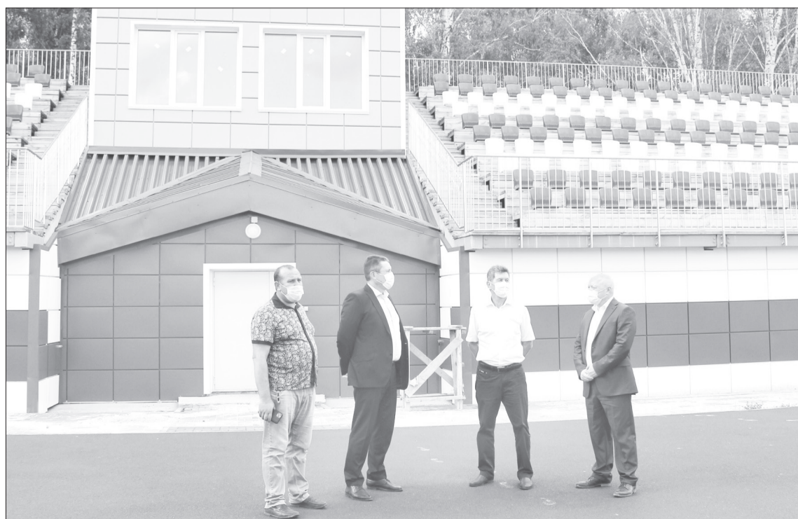
Новые трибуны решают сразу несколько задач. И речь не только о количестве зрительских мест, но и о комфорте спортсменов. Внутри конструкций расположены раздевалки, душевые и тренерские комнаты

Сейчас в подтрибунных пространствах разместили раздевалки, туалеты, душевые, тренерские. Это очень удобно. Кроме того, здесь же прячется один полезный секрет - выдвигная трибуна, которая добавляет еще несколько десятков мест. Ее планируют использовать для проведения крупных игр и соревнований. Надо отметить, что как стадион, так и трибуны выполнены с учетом потребностей спортсменов и зрителей с ограниченными физическими возможностями.