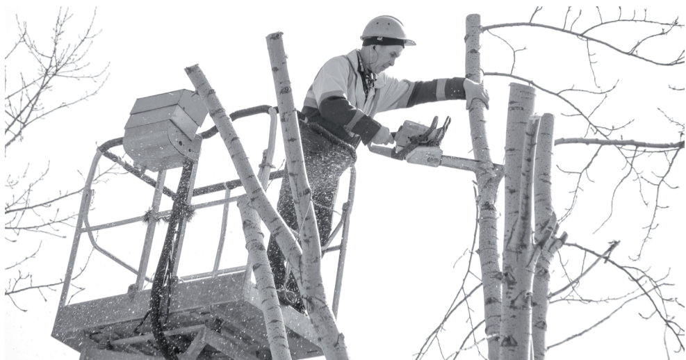
Ежегодные работы по формовочной обрезке САХ традиционно начинаются с февраля.

Обращения от ишимцев принимают в управлении ЖКХ, затем комиссия обследует зелёные насаждения, принимает соответствующие решения по каждой заявке и в рамках муниципального контракта передаёт их в САХ.