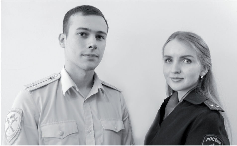
«В нашей профессии очень важны как моральная поддержка, так и дружеский совет. Мы всегда стараемся поддерживать друг друга», – признаются супруги Богдановы.