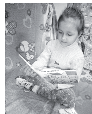
В фотоконкурсах «Я рекомендую книгу» и «Дома с книгой» читатели – дети и взрослые – показали любимые издания: «Мифы Древней Греции», приключения, рассказы о природе, сказки.»