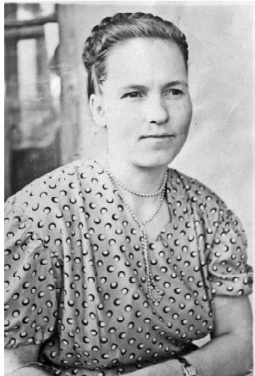
➤ В более зрелые годы

предки в Великую Отечественную войну, как сражались на уважения и светлой памяти