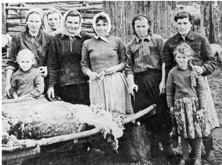
➤ Стрижка овец в совхозе «Коммиссаровский»