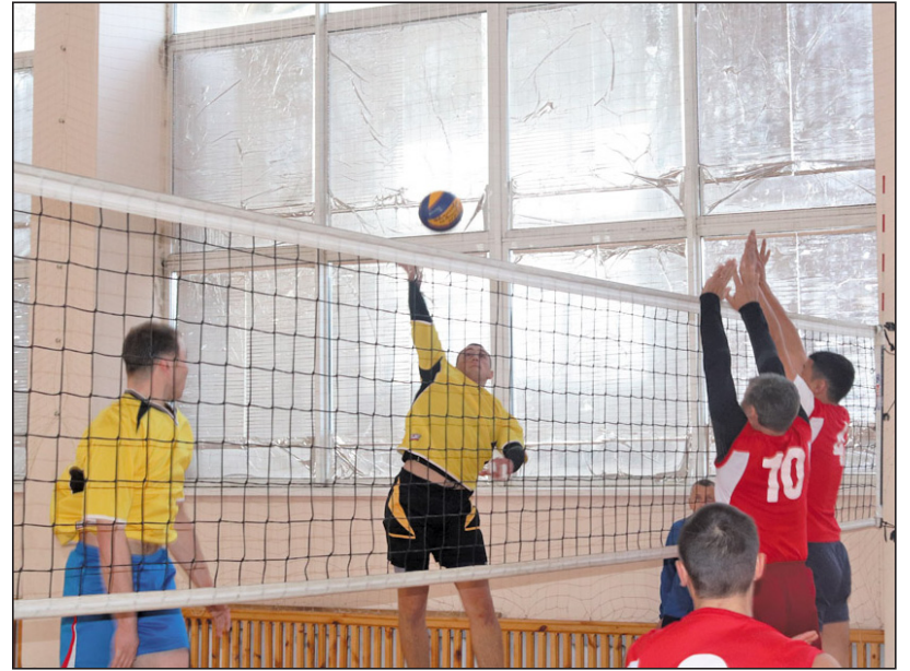
Атака соперника встречена двойным блоком

А в финальной встрече сразу же фавориты – «атланты» из Ялуторовска и спортсмены из Больших Ярков. Казалось, что даже стены спортивного зала во время этого поединка накалились. Но усилия большеярковцев всё же не увенчались успехом, им пришлось уступить соперникам. Несмотря на то, что заветный кубок уехал в город Ялуторовск, все участники турнира остались довольны. Награды в виде