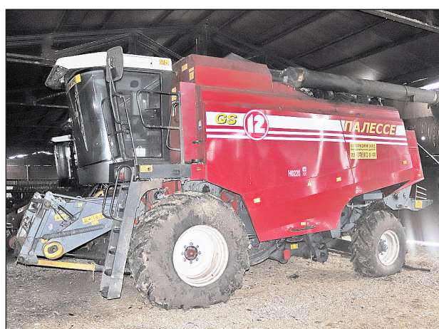
Для сельскохозяйственной техники в СХПК «Колхоз им. Кирова» созданы оптимальные условия хранения