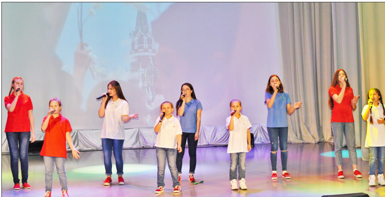
Девчата из вокальной группы «Каникулы» восхитили зрителей своей непосредственностью