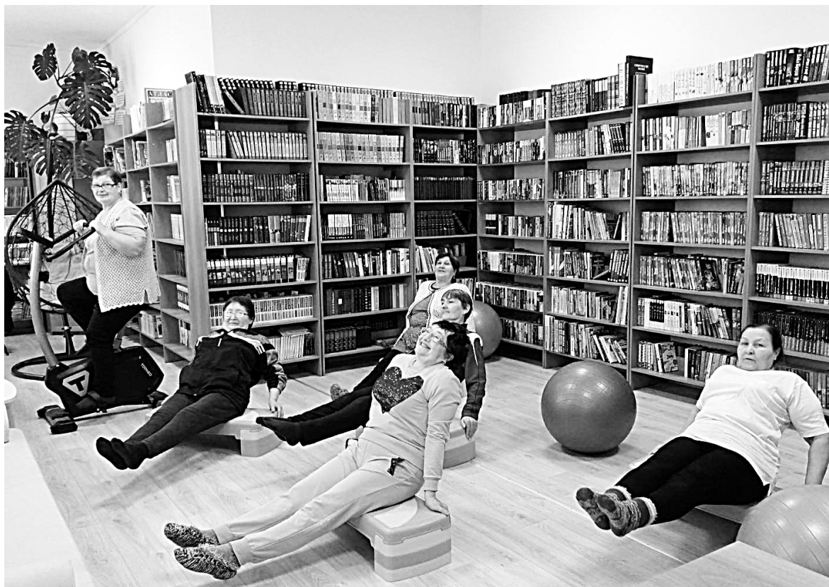
Для активного отдыха появились тренажеры, мячи и степ-платформы