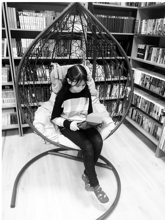
В уютном помещении можно читать книги в печатном и электронном виде, а также погрузиться в виртуальный мир с помощью VR-очков

На денежные средства гранта в нашу библиотеку было приобретено оборудование для разных возрастных