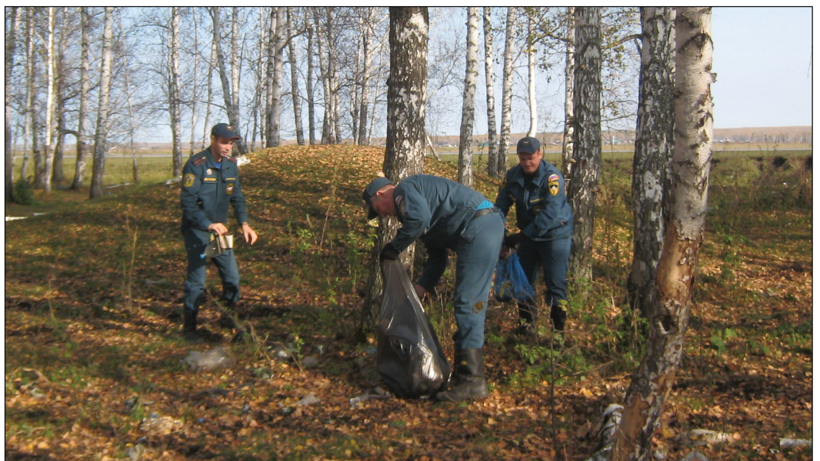
• Трудовой десант из отделения надзорной деятельности и профилактической работы наводит порядок в лесу.

Среди нас, наверное, не найдётся человека, который не любил бы природу. Мы все с большим удовольствием проводим время в лесу: собираем грибы и ягоды, ездим на пикники или отправляемся туда, чтобы просто погулять, полюбоваться красотой природы, подышать свежим воздухом, отдохнуть, набраться сил.