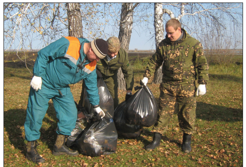
• Сотрудники ГБУ ТО «Тюменская авиабаза» на выполнении задачи по очистке леса.

Участники нынешней акции «Чистый лес» показали своё равнодушие к родной природе, району. Подавая именно такой пример, мы делаем общество чутьочку лучше и помогаем нашей планете. Нужно, чтобы каждый из нас понимал то, как много лес, реки, озёра, поля значат в жизни человека. Именно мы, люди, являемся хранителями и спасателями нашего огромного дома под названием Земля.