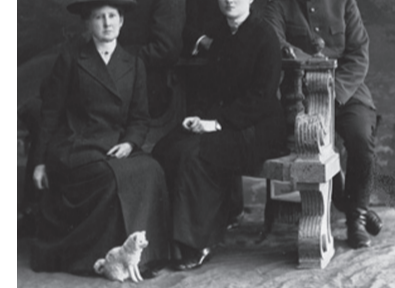
Верные слуги семьи Романовых. Тобольск, 1917 г.

Во время пребывания в Тобольске в 1917-1918 гг. семьи Романовых именно в ателье Уссаковской венценосные узники покупали открытки. Это подтверждается сохранившимися счетами из фотоателье Уссаковской за «напечатание открытых писем».