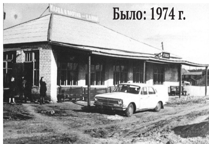
Было: 1974 г.

С автостанции автобусы отправляются как по территории района, так и в города Ишим, Тюмень, в Викуловский район.