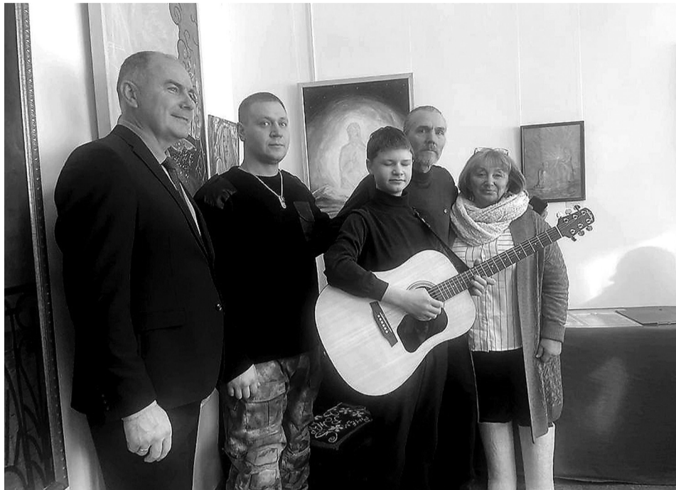
На снимках: фрагменты выставки

"После переезда в Россию я понял, что здесь тоже много чудесного: необыкновенное небо и облака, леса до самого горизонта, всё это тоже всегда завораживало, – рассказывает он. – Неизвестность, бескрайность, волнующая красота простора и природы – вот что наложило неизгладимый отпечаток на мою