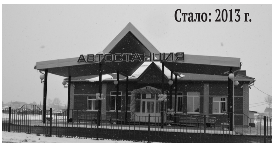
Стало: 2013 г.