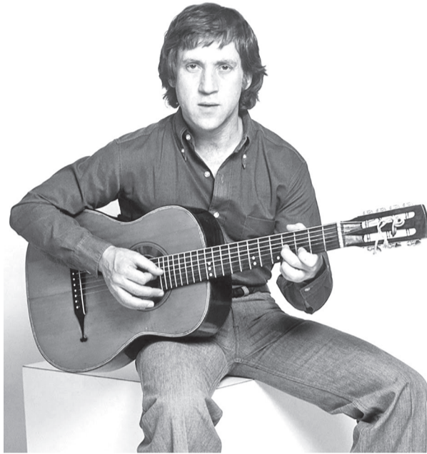
• На книжной выставке в центральной библиотеке, посвящённой 80-летию Владимиру Высоцкому, представлено как творчество самого поэта, так и воспоминания о нём современников.