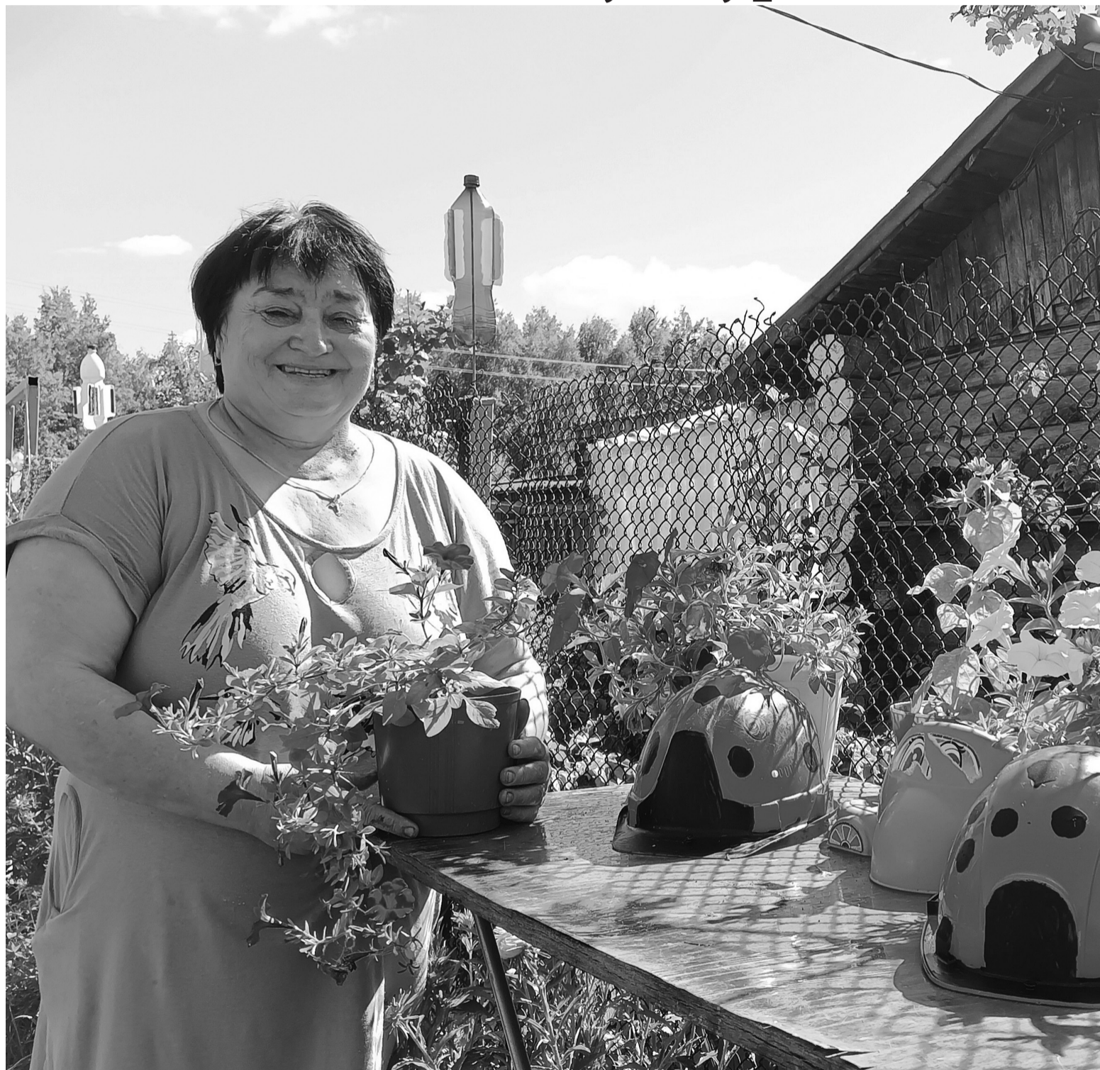
Всего за полтора года женщина создала уют на своём приусадебном участке

Приближается осенняя пора, пора сбора урожая, а значит, пришло время для традиционного областного и районного конкурса «Ветеранское подворье».