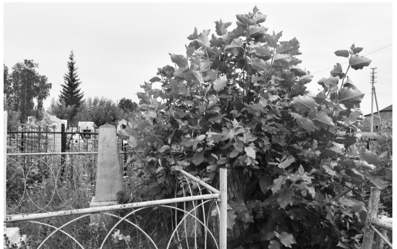
Тополиная поросль быстро разрастается. Её нужно своевременно убирать

В данное время на пенках вырубленных деревьев появилась поросль. Прошу обратить на это внимание. Если возле захоронений ваших родных есть пенки и на них появилась поросль, её необходимо вырубать, иначе она вновь разрастётся и заполнит всё кладбище. И всё то, что сделано ранее, окажется бесполезным. Не составит труда убрать мусор и с заброшенных могил (хотя бы с одной), которые находятся рядом с захоронениями ваших род-