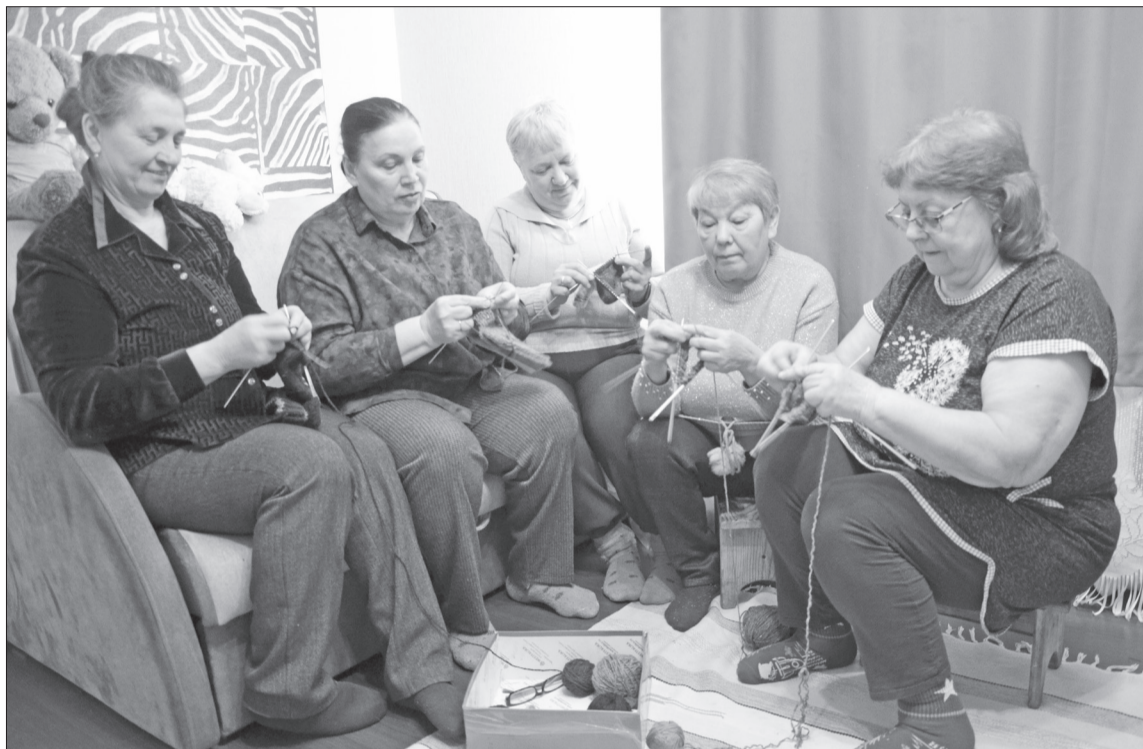
Ветераны особого назначения периодически встречаются не только за чашкой чая, но и за спицами.

Жители Крысовой продолжают активно оказывать поддержку воинам-землякам