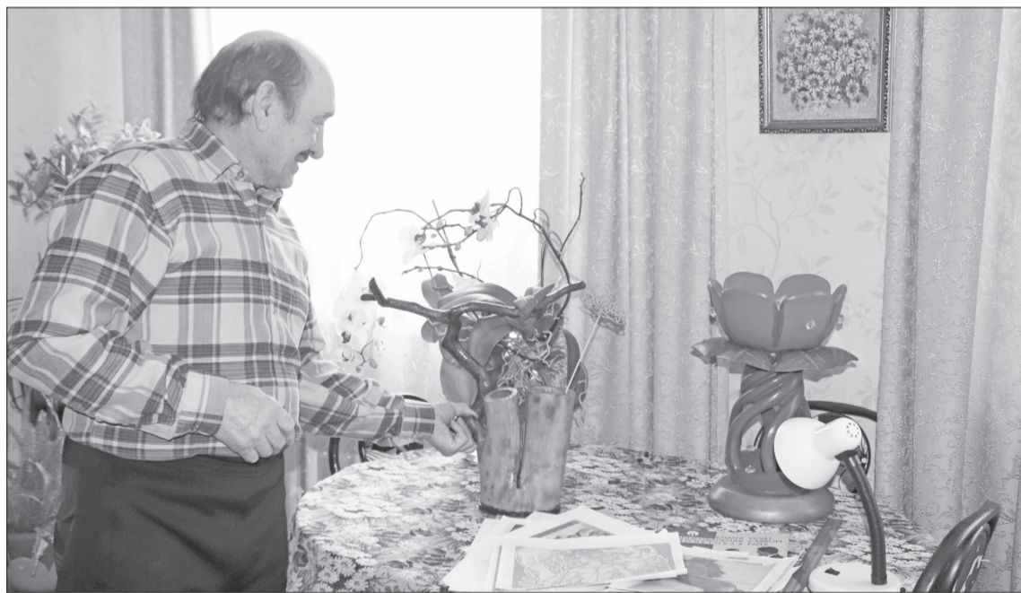
Такие скульптуры украшают интерьер дома Абрамовых.

Тавде, здесь школу окончил и сразу же ушёл в армию, служил в ракетных войсках. А после службы отправился в Верхнюю Тавду, где поступил в школу комсостава речного флота. Потом работал рулевым-мотористом. Через год, получив диплом второго помощника, водил речной буксир.