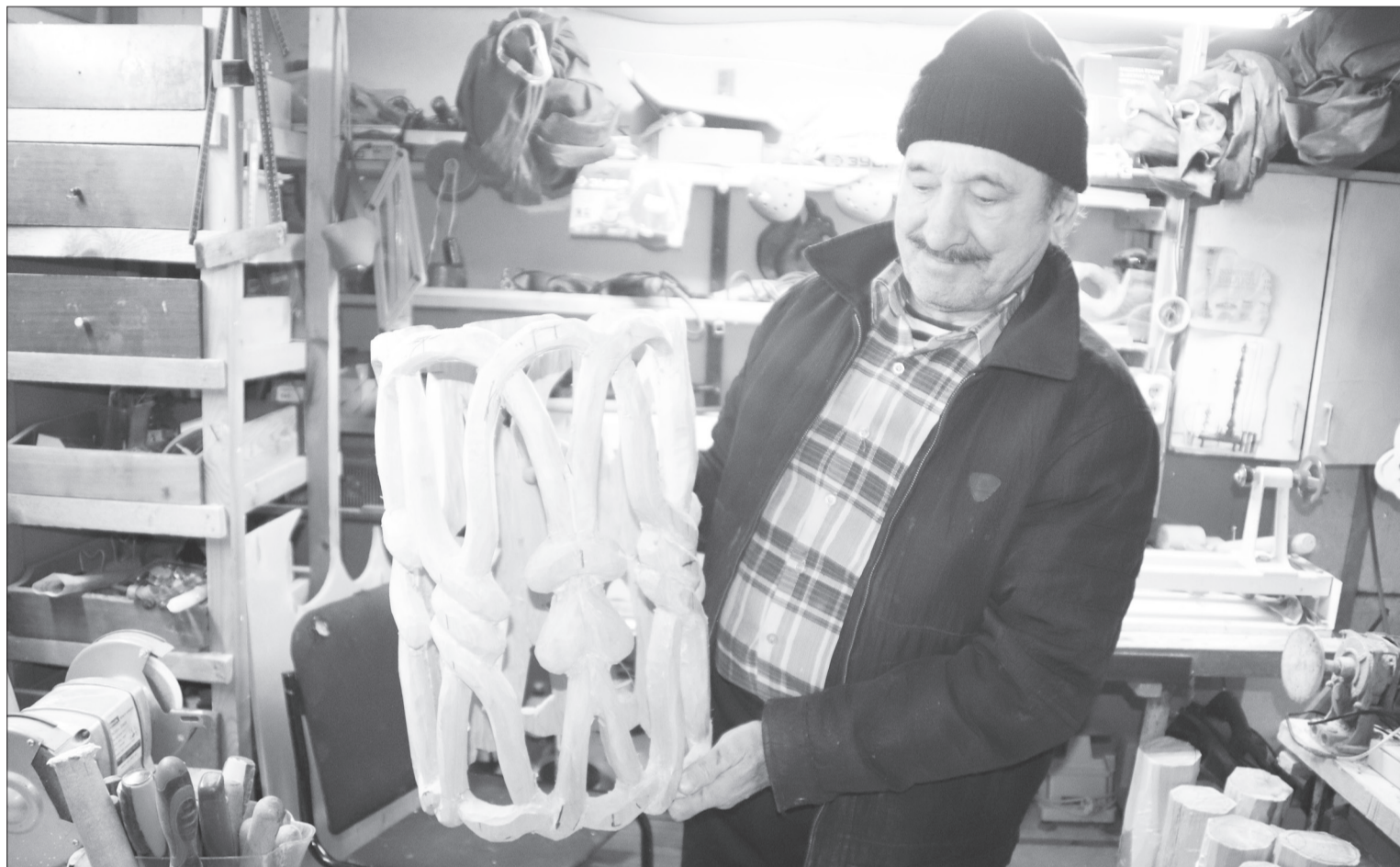
Скоро эта работа приобретёт окончательный вид и новый вазон займёт достойное место.