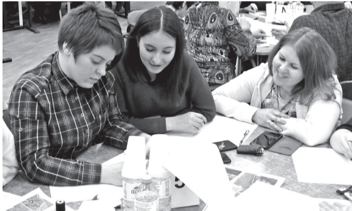
• Интересы у всех участников обсуждения будущей жизни парка разные, а территория одна. Но в спорах рождается истина.

Пожелания заводоуковцев, сформированные в единый проект, архитекторы регионального отделения общероссийской организации «Городские реновации» в феврале отправят в Минстрой на