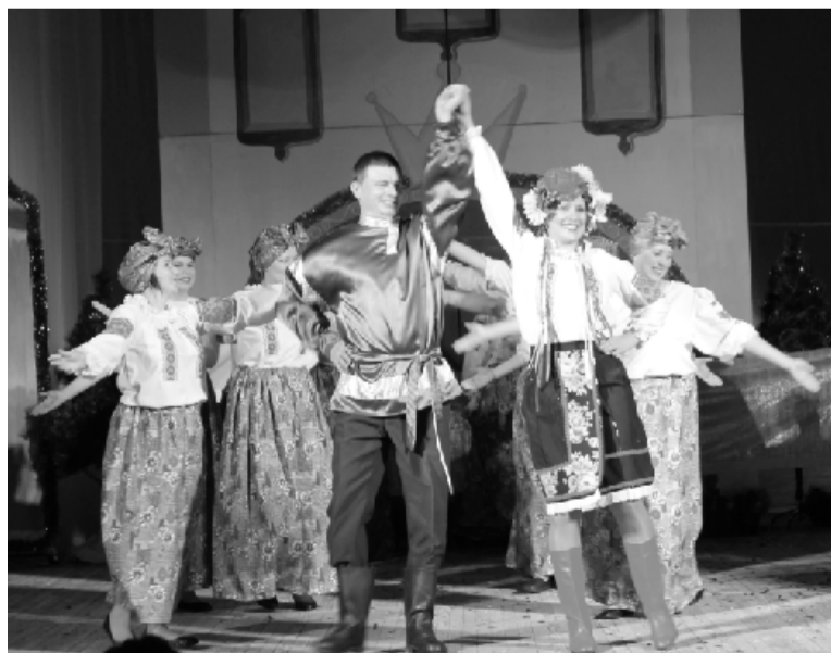
Постановка «Свадьба в Малиновке». Коллективы школы № 1 и коррекционной школы-интерната.