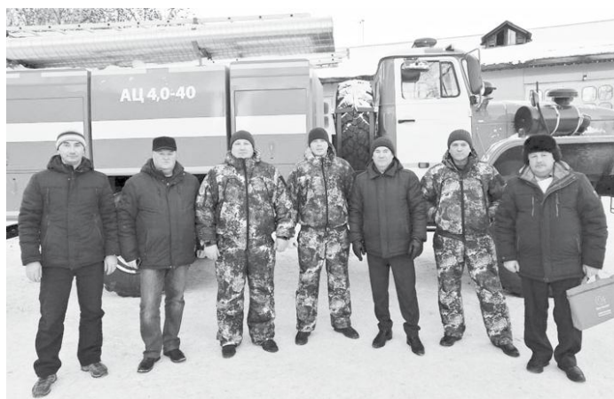
Новый автомобиль получили истошнинские пожарные.

выпуска. Благодаря новому автомобилю пожарные смо-