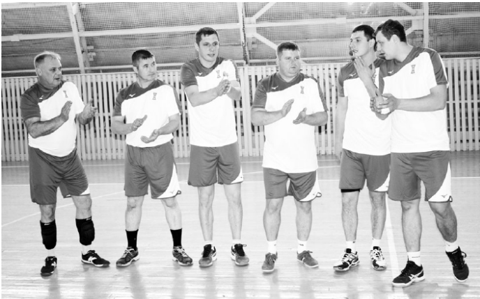
Команда бердюзских волейболистов.