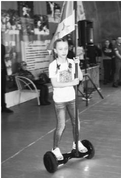
Равнение на флаг!