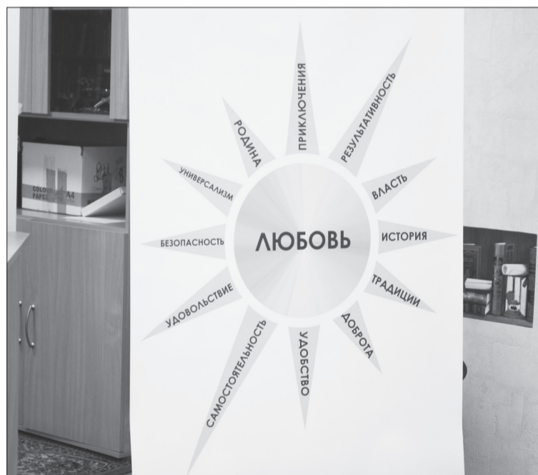
☑ В основе человеческого существования, сошлись коллеги, лежит любовь.

важно нам всем и каждому родителю в частности прилагать усилия, чтобы заложить в своё дитя духовный фундамент», – отметил он. На службах в Киндерской мечети, добавил имам, бывает примерно 15-20 подростков.