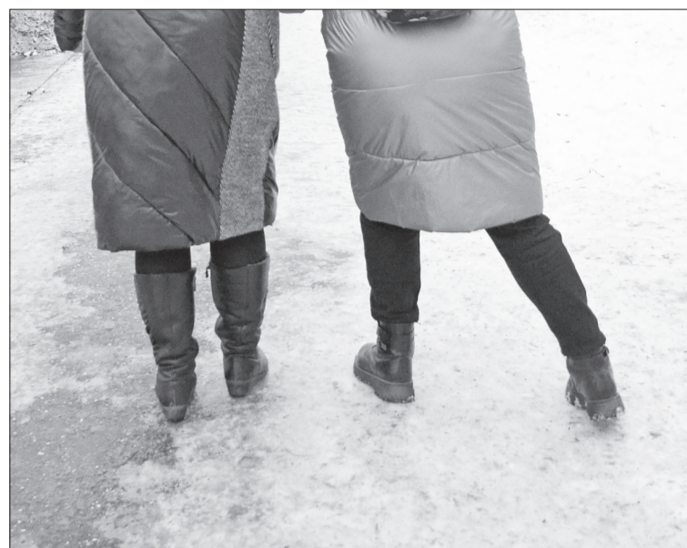
Ⓜ Опасное явление – гололёд.

Желательно покидать помещение в бодром расположении духа, это позволит вовремя сконцентрироваться и избежать травмирования. При ходьбе мышцы должны быть в тонусе, это защитит кости при падении от повреждений. По льду нельзя спешить, нужно идти спокойно и уверенно, делая каждый шаг на всю стопу. Желательно, чтобы руки во время движения по гололёду были свободными, чтобы в случае скольжения можно было опереться. Пожилым людям лучше использовать трость с резиновым наконечником. Не держите руки в карманах – так нарушается равновесие. Во избежание перелома при падении не выставляйте