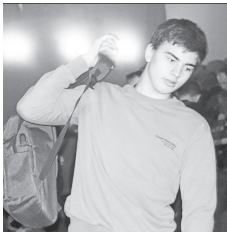
Будущему призывнику есть время подумать о том, где он будет проходить службу.