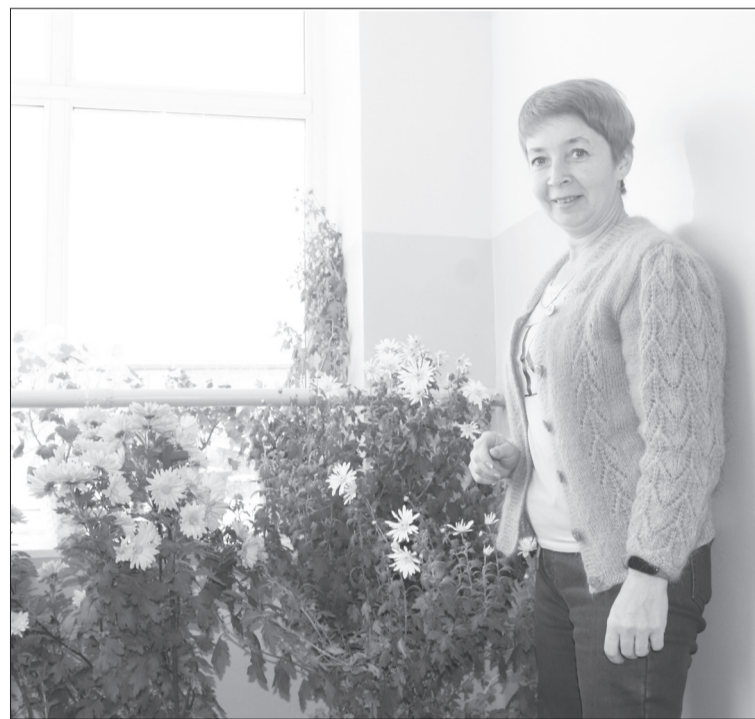
Вот такую цветущую красоту выращивает у себя в подъезде наша героиня.