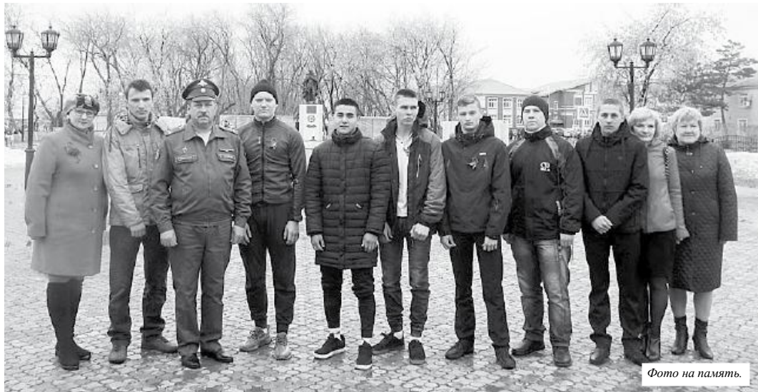
Фото на память.