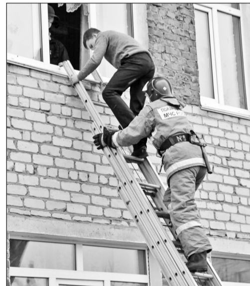
Эвакуация школьников из заблокированного кабинета

уже работали сотрудники вневедомственной охраны. Сотрудники пожарной охраны действовали также слаженно: они установили металлическую лестницу и помогли учащимся, оставшимся в заблокированном кабинете, спуститься вниз. Травмированного во время эвакуации юношу аккуратно сняли с лестницы, уложили на носилки и транспортировали в больницу.