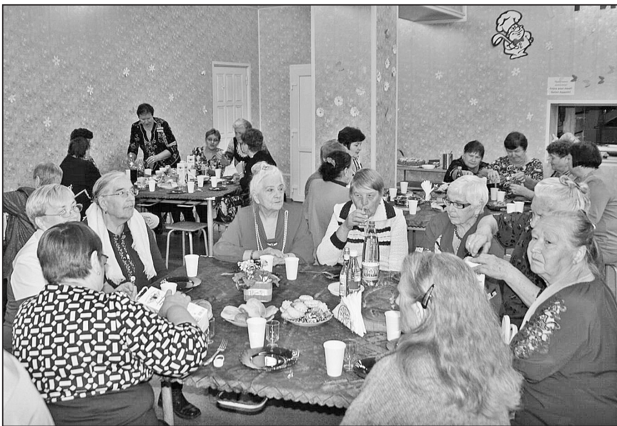
Праздник прошёл в тёплой и дружеской атмосфере

— Особо хочется отметить наших ветеранов — фельдшеров, которые несли свою нелёгкую службу вдали от райцентра. Эти люди — энтузиасты своего дела, честно, бескорыстно, внимательно заботились о