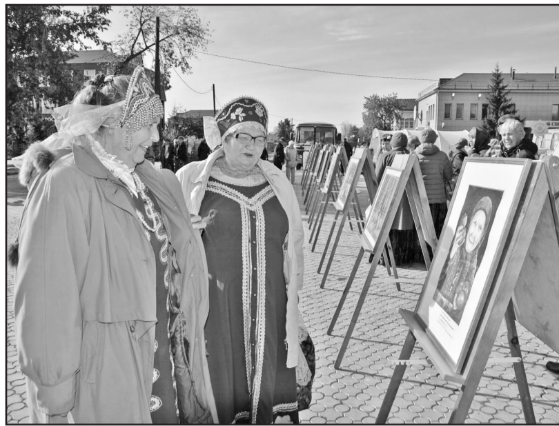
Выставка художественных работ воспитанников детской школы искусств особо восхитила гостей праздника

Уважать людей пожилого возраста меня, как и большинство других людей, учили с самого раннего детства, что я и стараюсь делать. Но, честно признаюсь, праздник этот не люблю. Знаю, что проводится он для того, чтобы привлечь внимание окружающих к проблемам людей преклонного возраста, что-