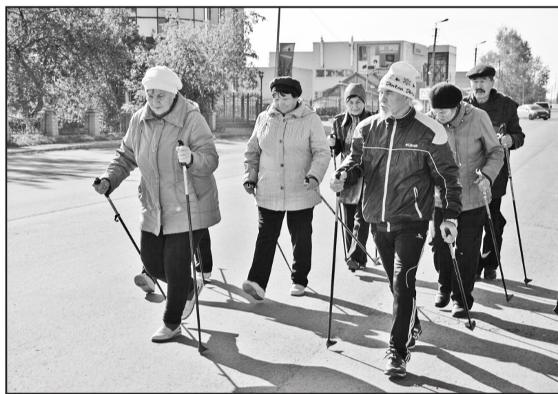
Чтобы быть молодым душой и телом, надо сохранять здоровье и бодрость духа

бы можно было лишней раз проявить о них заботу, оказать помощь тем, кто в ней нуждается. Но мне очень не хочется, чтобы люди, которых я знаю давно и помню в расцвете сил, старели. Понятно, над вре-