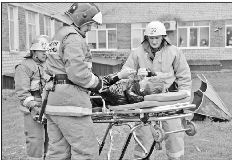
Юноша пострадал, но его вовремя доставят в больницу и окажут помощь

А после полудня на территории Новоселёвской школы были организованы практические командно-штабные учения с участием сотрудников пожарной, медицинской служб, отдела внутренних дел.