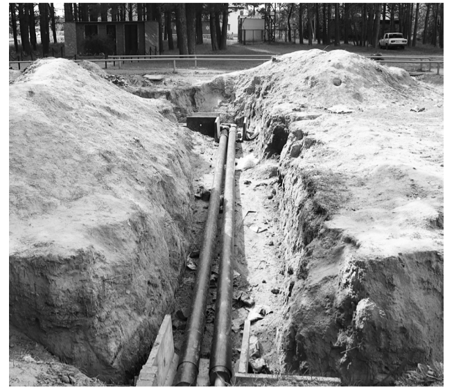
Заканчивается ремонт 750 метров теплотрассы.