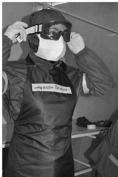
Сорокинские медики уже имеют опыт работы в моногоспитале