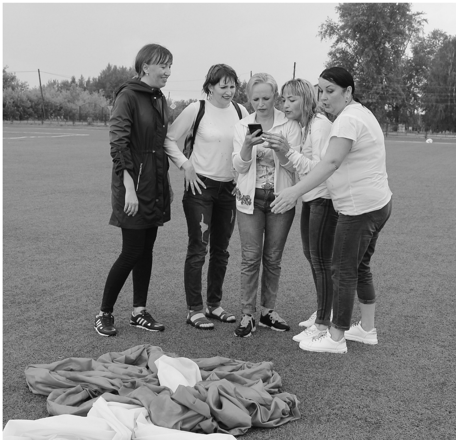
Молодёжные команды, несмотря на дождь, пребывали в хорошем настроении

– За 10 дней до праздника на страничке группы Сорokinского