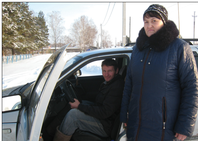
◆ Супруги Овсянниковы из Смородиновки.

Для большинства сельчан подсобное хозяйство по-прежнему остаётся одним из основных источников дохода. На столе всегда есть свежие натуральные продукты: мясо, молоко, сметана, масло, творог... При желании, возможно реализовать излишки и тем самым пополнить семейный бюджет.