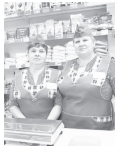
|| Коллектив гаёвского магазина