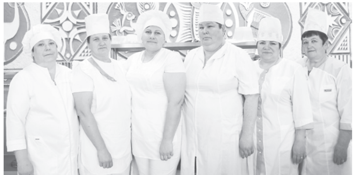
|| Коллектив столовой. Фото автора