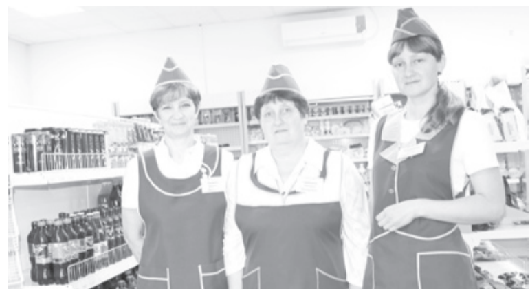
|| Коллектив бархатовского магазина