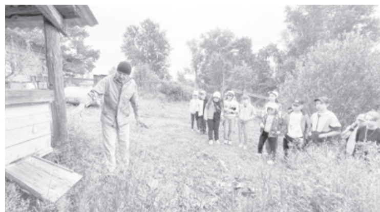
|| Фото из архива бобылевской школы

Участвуя и побеждая в общелагерных мероприятиях, ребята зарабатывают Звездочки, которые идут в отрядную кассу. Этими «деньгами» разрешено оплатить плавание всего отряда в бассейне, экскурсию с вожатым и ответ-